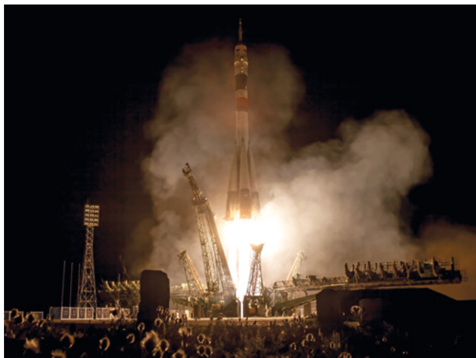
Irány a kozmosz!

deklódnak napjaink legizgalmasabb és legsokoldalúbb tudományos és technikai munkái, az embernek a világuőrhöz kapcsolódó tevékenysége iránt.