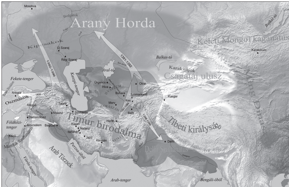
1. térkép Timur Lenk birodalma 5

megértéséhez. A tanulmány első fele a hadjárat okait vizsgálja, a következő rész magával a hadjáratral foglalkozik, ezután a csata elemzése következik, majd a hadjárat lezárását ismertetem. Végezetül pedig a következtetések levonásával zárom a tanulmányt. Következtetésem szerint Timur egy nála jóval erősebb oszmán haderőt győzött le, amelyet sikerült kifárasztania és felbomlasztania. Ez a felbomlasztás nem azonnal, hanem több lépcsőben valósult meg. Végül a hadjáratát az oszmán területek feldúlásával fejezte be, hogy ezzel ilávetett státuszba kényszerítse az oszmánokat.