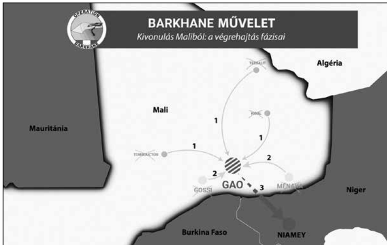
3. ábra A Barkhane kivonási fázisai 67

Calviban települő 2. ejtőernyőszeredeből – 2e REP 68 ) hagyta el az utolsó pillanatig titokban tartott „Jour J” 69 napon. A Niamey-ba visszavont jármű- és konténerállomány nagy része azonban nem maradt Nigerben, hanem részben Nigerből légi, részben Abidjanból (Elefántcsontpart) és Cotonou-ból (Bénin) vízi úton szállították vissza Franciaországba.