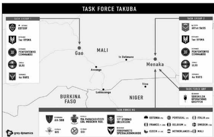
1. ábra Task Force Takuba 44

Lényegében a napi rutin szintjén a Barkhane is hasonló feladatokat látott el, csak más területi zónákban. Összehasonlításként a Barkhane egy napja Délnyugat-Maliban az alábbiak szerint telt. A nap „vadkempingezéssel” kezdődött a műveleti zónától 30 km-re, ezt követte a hajnali indulás, melynek során a járművek – a Takuba főként páncélozatlan járműveivel szemben páncélozott szállító harcjárművekkel és könnyű páncélozott járművekkel 41 – soha nem a bejáratott utakon, hanem például kiszáradt prériken, kavicsagyakon és folyómedreken keresztül közelítették meg a helyszínt, hogy elkerüljék a rögtönzött robbanóeszközöket. 42 Majd járőrözés következett a mali hadsereg egységeivel karöltve, terrorista sejtek felkutatása, fegyverek begyűjtése, eszközeik megsemmisítése céljából. A tevékenység folyamatos légi fedezet – amelyet pl. Mirage 2000D repülőgéppel hajtottak végre – mellett zajlott. 43