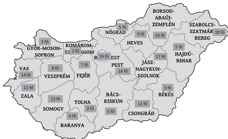
2. ábra A kérdőívet kitöltők megyei eloszlása (Készítette a szerző)

A kérdőívet kitöltők megyei eloszlása jól szemlélteti, hogy a legtöbb megyében jól kezelhető, 29 kics csoportos formában kezdték meg a jelentkezők az alapkiképzést, amelyben a kiképzők és kiképzendők aránya az MH más kiképzéseihez képest jelentősen jobb arányt mutatott. 30