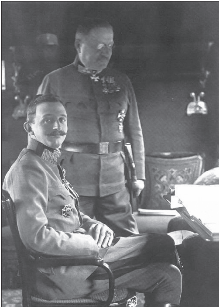
IV. Károly és Arz

Az uralkodó álláspontját a 11. isonzói csata veszteségei visszaigazolták. Az olaszok mintegy 170 ezer katonát vesztek, és a csatában részt vevő zászlóaljaik átlagosan 50–65%-os veszteséget könyvelhettek el. 28 Megrendítő volt a Monarchia vesztesége is, amely 100 ezer katonára rúgott, ugyanakkor a hősiesség védekezést bizonyította, hogy a hírhedten szigorú eljárás után elnyerhető Mária Terézia Katonai Rend Lovagkeresztjében öten részesültek, a Parancsnoki Keresztet pedig egy tábornok kapta meg. 29