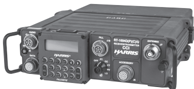
1. ábra AN/PRC-150(C) HF/VHF korszerű harcászati rádió

A berendezés részegységei többnyire kompatibilisek más, a családba tartozó hasonló rádiók moduljaival. Felépítésének köszönhetően alacsony meghibásodási rátával rendelkezik, és a felmerülő anomáliák megoldásában jelentős szerepet játszanak az integrált rendszervizsgálati eljárások. Ezek segítségével könnyen kiszűrhető a meghibásodott részegység, ezért lényegesen felgyorsítható, illetve egyszerűsíthető a szerviztevékenységhez szükséges logisztikai (műszaki) anyagutánpótlás és -ellátás. 16 A Magyar Honvédségben rendszeresített gép- és harcjárművekbe épített parancsnoki rádiókomplexumok (Pk 1-4) elsődleges rövidhullámú rádiója az AN/PRC-150(C), amely az 1. ábrán látható.