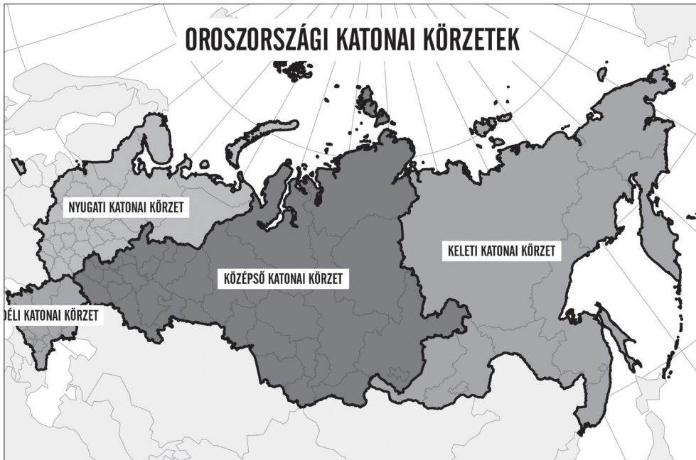
4. ábra Oroszország katonai körzetei