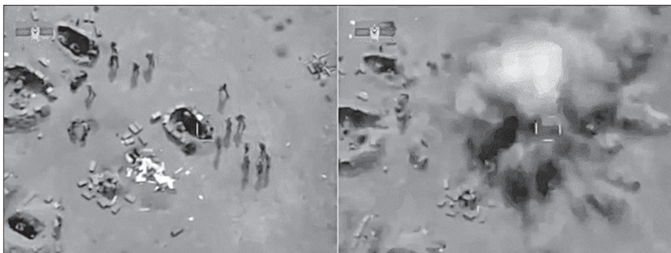
1. kép Részletek egy azeri UAV felvételéből, amint egy örmény állást semmisít meg 14

csapatok előrenyomulását, ami Terter és Fizuli térségében volt lehetséges. 10 Azerbajdzsán a háború első napjától kezdve kezdeményező volt, és minden eszközt megragadott, hogy a kezdeti fölényt a későbbiekben a siker továbbfejlesztésére fordítsa. Nemcsak a frontvonalon lévő állásokat pusztították, hanem Hegyi-Karabah infrastruktúráját is, hogy a harcoló erők ne jussanak utánpótláshoz. 11 Az örmények védelme jól szervezett volt, de nem számoltak ekkora erejű dróncsapásokkal, ami meghozta a sikert az azeri katonai vezetésnek, így mérsékelni tudták élőerő-vesztéseiket. Hegyi-Karabah hadereje már a háború elején demoralizálódott, mert az azeri Védelmi Minisztérium közzétette a légi csapásokról készült videókat. 12 Azerbajdzsán eleve úgy tervezte meg katonai műveleteit, hogy délen próbálja kihasználni a terepadottságokat, hiszen ott Iránhoz közelebb alacsonyabbak és kopárabbak a hegyek. Ez jobban kedvezett az UAV-ok alkalmazásának is. 13