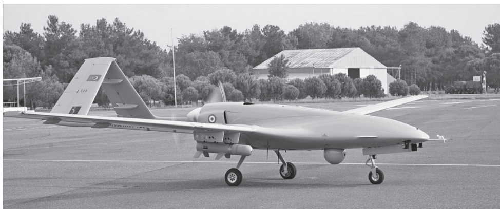
2. kép Egy török gyártmányú Bayraktar TB2 típusú UAV MAM-L rakétákkal felfegyverzve 24

Október 19-én az azeri erők délen folytatták a támadást nyugati irányba, Gubadli városa felé. Itt nagyon dinamikusán haladtak előre, október 20-ra elfoglalták Zangelant, és 22-én elérték Örményország délkeleti határvonalát is. Itt vigyáztak, nehogy átlépjék a határt, mert tartottak attól, hogy az örmények az oroszokat fogják segítségül hívni a 2010-es kölcsönös védelmi egyezmény értelmében. Közben megint volt egy egynapos tűzszünet 26-án. 25 Másnap az azeri szárazföldi erők elfoglalták Gubadlit, így lehetőségük nyílt Susa és a lacsini folyosó irányába történő támadásra. Október 27-én még egy nagy esemény történt, ez pedig Adel al-Saher halála, aki a Hamza Division elnevezésű szíriai milícia parancsnoka volt. A milícia zsoldosai valószínűleg török segítséggel jutottak Azerbajdzsánba a harcok támogatására. Az örmények számára ez óriási siker volt, hiszen sokáig folyt hajtóvadászat a férfi ellen Szíriában; halálát nem tudták felhasználni a morál növelésére, 26 aminek nem lehet tudni az okát.