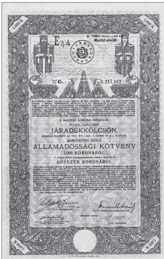
2. kép Hadikölcsönkötvény (1915)

A hetedik hadikölcsön országos eredményessége valószínűleg annak volt köszönhető, hogy azt honvédek és népfelkelők is tömegesen jegyezték. A váratlan sikert a kormányzat a következő alkalommal is igyekezett megismételni, ekkor azonban már a honvédelmi miniszter