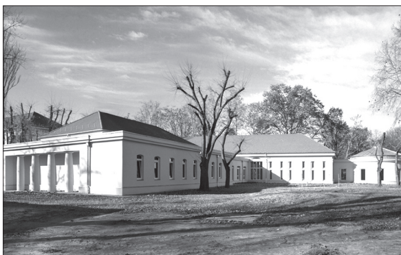
5. kép A hajdanvolt Tiszti Kaszinó