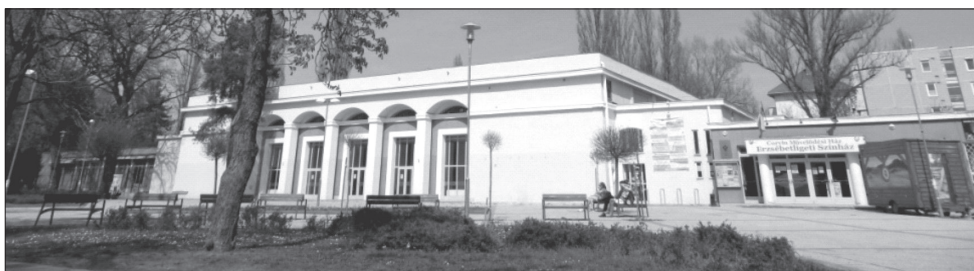
6. kép Az egykori sportcsarnok