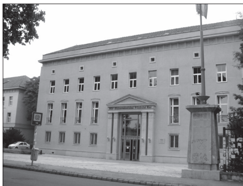
3. kép A katonai középiskola főépülete