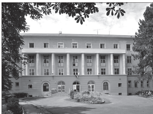
2. kép A kecskeméti Repülőkórház napjainkban

azonban a középrizalit nem éri el a tető vonalát: egy ablaksorral alacsonyabbra tervezték, helyet hagyva a timpanonnak. Hangsúlyos, kiugró zárópárkányzat tagolja a homlokzatot, de ezzel is élénkíti az épület optikai hatását. A párkányzat teljes hosszában nyolc vastkos oszlopra támaszkodik, nem nagy, nehogy nagy árnyékot vessen. A mélység dinamikája a felülettől csak kismértékben lép ki: az oszlopsor a reneszánsz egyik legfontosabb eleme volt, a modern építészet kezdetéig használták. A klasszicista homlokzat összhatásánál nem maradhat el a földszinti övpárkány, a kváder hatású lábazati rész, amely az épületen végig körbefut, magában foglalva az öt, boltíves bejárati ajtót. A téglalap formájú ablakok szintenként eltérő méretben, de egyenletes ritmusban követik egymást, kereteik mérsékelten plasztikusak. Az épület monumentális tömbje T alaprajzú madártávlatból. A bejárat hangsúlyozására több lépcsősor vezet felfelé, amely a teret tágítja az íves, kiszélesedő út által.