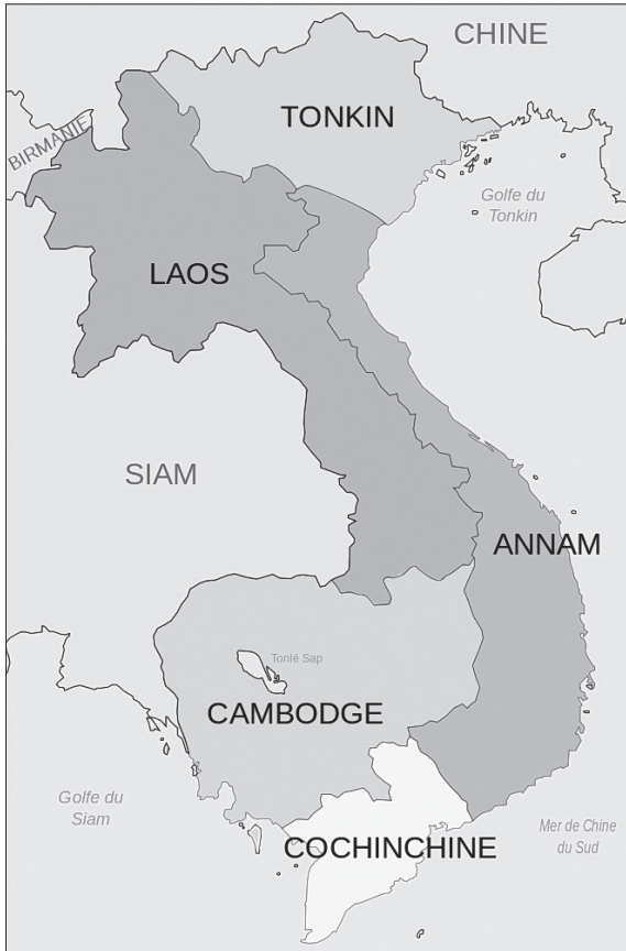
1. ábra Francia Indokína részei 27

Ez a szervezet a japánokkal történt megegyezésnek megfelelően 1940–1945 között is fennállt, de a gyarmati kötelekeket részben lefegyverezték és kevés funkciót hagytak meg nekik – nagy részüket passzivitásra, míg egy részüket gerillaharcra kényszerítve. Ez a helyzet egészen 1945 márciusáig nem változott, akkor a császári erők lerohanták a francia laktanyákat és hadifogságba ejtették a túlélőket. 26