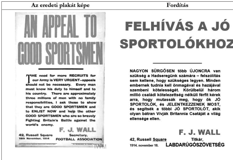
2. ábra A brit Labdarúgó Szövetség titkárának toborzást célzó felhívása a jó sportolókhoz 1914-ből (Forrás: 9 Facts about Football in the First World War)