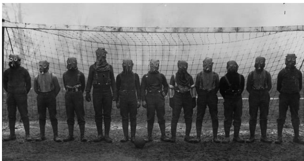
4. ábra Egy első világháborús brit futbalcsapat gázálarccal pózol 1916-ban

A csoportkohézió és az összetartozás érzése lényeges összetevője a katonai egységek, alakulatok hatékony működésének, amit tehát a labdarúgás nyújtotta játékelmény révén felnőttek körében is erősíteni lehet. (4. ábra)