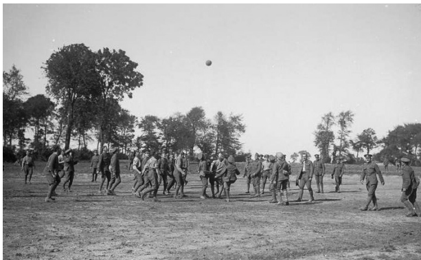
3. ábra A brit 1. zászlóalj csapatai (Wiltshire ezred) futballoznak Bouzincourt közelében 1916 szeptemberében