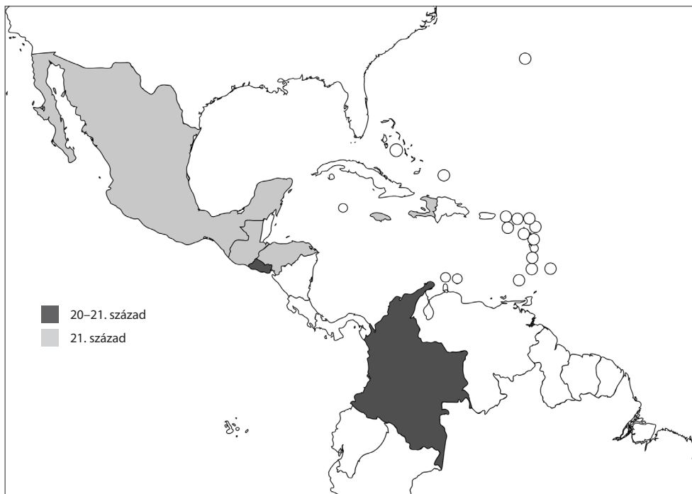
1. térkép Délkelet-Ázsia és Latin-Amerika