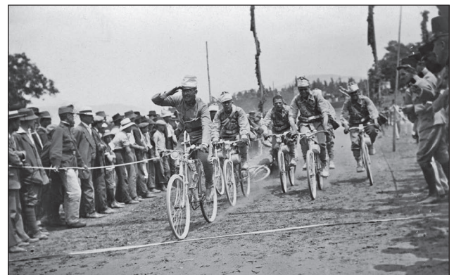
6. ábra. Kerékpáros járóverseny 1913-ban az olaszországi Görzben (Gorizia)

Schöner Odiló századost 12 nevezték ki. Első feladatuk hadműveleti felderítés volt, közben augusztus 15-én a lengyelországi Morawica-nál átestek a tűzkeresztségen, s még aznap az ugyancsak lengyelországi Kielcénél harcba léptek, mint hadosztályelővéd. Ezt követően a zászlóalj utóvédként tevékenykedett, közben a nehéz terepviszonyok miatt ideiglenesen többször meg kellett válniuk a kerékpárjaiktól. A zászlóalj a lovashadosztály alárendeltségében töltött 17 nap alatt 395 km-t menetelt. Ezt követően közvetlenül a lovashadosztályt is magába foglaló Kummer hadseregcsoportnak 13 rendelték alá, fő feladatuk önálló felderítés és biztosítás volt, majd augusztus 31-étől a hadseregcsoport Landstrum-gyaloghadosztályainak (95. és 106.) alárendelt-