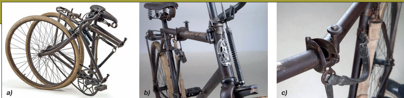
9. ábra. A grazi Waffenfabrik gyár 97. sorszámú összecukható katonai kerékpárja összehajtott állapotban a), nyitott állapotban útrakészen b), lazított csuklópánttal és bőrszíjjal c) [14] [15] [17]

a völgyállásokat megtisztította az ellenségtől, a 24. kerékpáros század pedig a Piano lejtőin az ellenséget eredeti állásaiba visszaszorította. A század parancsnoka, Klaus Kálmán főhadnagy 17 , 17 vadással együtt elesett. Temetéséről zászlóaljparancsnoka így írt: „17 h 45 I-kor a bajor alpesi hadtest, a Pustertali hadosztály és az 56. hegyi dandár küldöttségeinek jelenlétében és a bajor testőrezred zenekarának közreműködésével megadjuk a végtisztességet Tirol földjének védelmében elesett Klaus Kálmán főhadnagynak, kinek holttestét századának egyik szakasza ellentámadással visszahozta az ellenség soraiból, hol a roham alkalmával szívővésszel elesett.” [7; 45. o.]