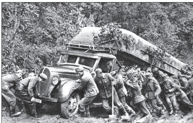
34. ábra. A pontonok előrevonása komoly nehézségekbe ütközött

csoport alárendeltségében tevékenykedő két közelfelderítő század is folytatta a felderítési feladatait a harcászati mélységben. A 4/3-4. és a 3/5. bombázórepülő-századok támadták Kamenyec-Podolszki-Borscsöv-Csorkov helységeket, illetve az erődvonalukhoz visszavonuló ellenséges menetoszlopokat, amelyek a Dnyeper mentén nagyon sokszor komoly ellenállást tanúsítottak a magyar csapatokkal szemben [1, 80. o.].