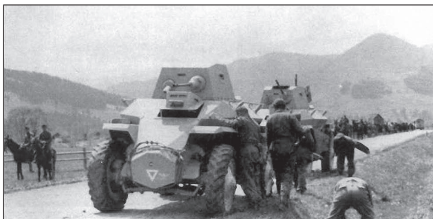
36. ábra. Kijutás a Kárpátokból

Ekkora már az 1. gépkocsizó dandár már Gyeljatyinig jutott előre.