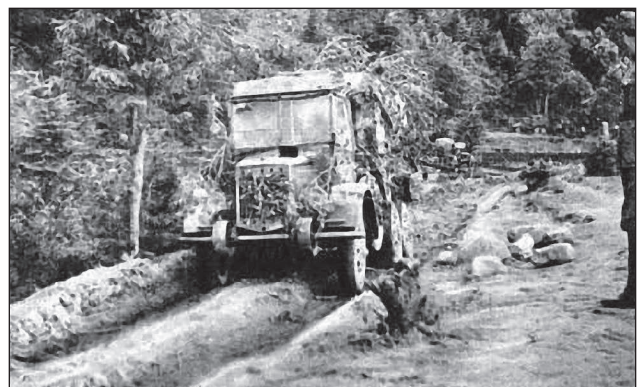
30. ábra. Úttalan utakon

A Pisky-csoport a nap során zászlóaljaival elérte Ludovika, illetve Tyereskova körzetét, miközben a felderítő szervei már Vigoda irányában folytatták feladatukat. A bal szárnyon előrenyomuló alegységek Sztrij térségében – a kisebb kezdeti együttműködési nehézségek után 81 – felveték az összeköttetést a szomszédos német csapatokkal és biztosították a Kárpát-csoport bal szárnyát. A dandár bal