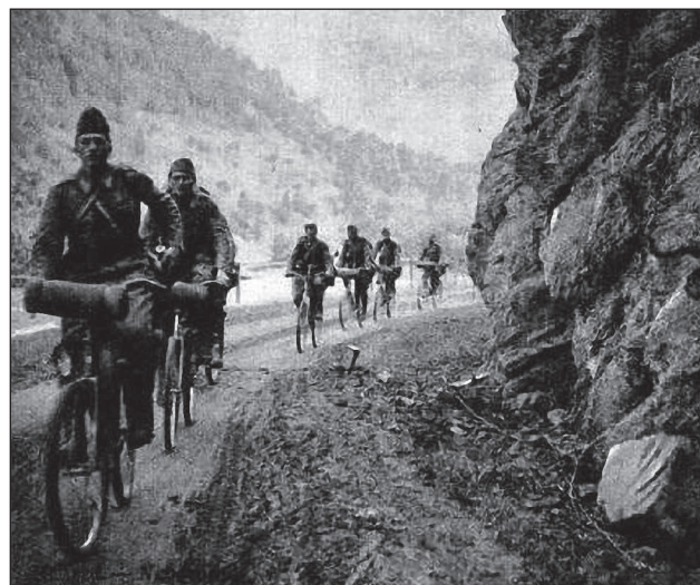
35. ábra. Kerékpáros csapatok a Prut folyó völgyében

A Nyizsnyovban lévő, még ép Dnyeszter-híd birtokba vételére a 12. kerékpáros zászlóaljat indították Sztanyiszlavon keresztül, de végül ezt a feladatot az 1. gépkocsizó dandárnál kedvezőbb megközelítési helyzetben lévő 10. kerékpáros zászlóalj hajtotta végre.