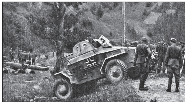
33. ábra. Ha az utak nem járhatók, akkor a terepen kell biztosítani az előrejutást

utóvéd kiverése után, majd a helyiség megtisztítását követően, a területet biztosította.