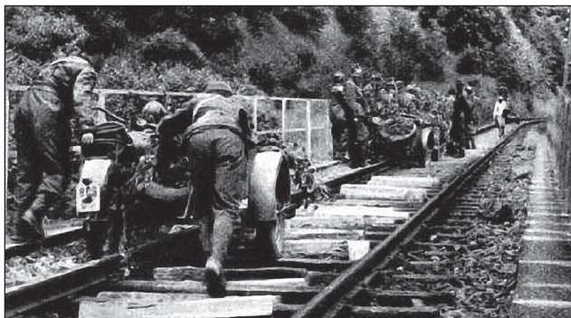
31. ábra. ...ha kell a vasúti pályán, de előre!

szárnyán harcoló 25. határvadász-, 1. hegyi és VIII. kerékpáros zászlóaljak Kamionkán és Bolohovon át, a jobb szárnyon lévő 2. hegyi és 10. határvadász-zászlóalj pedig a Svica völgyében, Vigoda falun keresztül, Dolina településre való beérkezést kapták feladatuk. A 15. kerékpáros zászlóaljat Volócról Viszkovon át, egyenesen Dolinára csoportosították át.