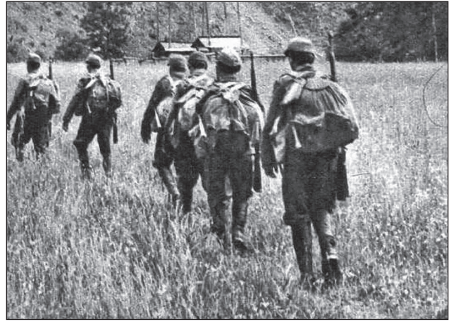
29. ábra. Az első honvédjárőr a Kárpátok túlsó oldalán

jet csapatok a Vigodánál lévő Svica-hidat és az Opor híd-jait is felrobbantották [4, 71. o.]