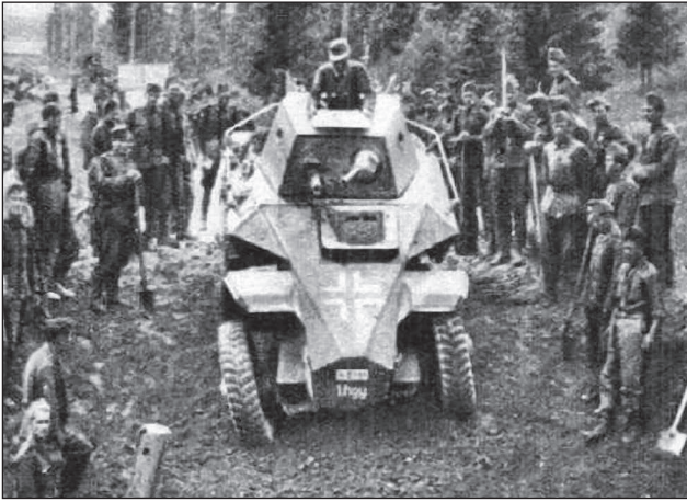
28. ábra. A rombolt utakon páncélgépkocsikkal nehéz volt az előretűnés