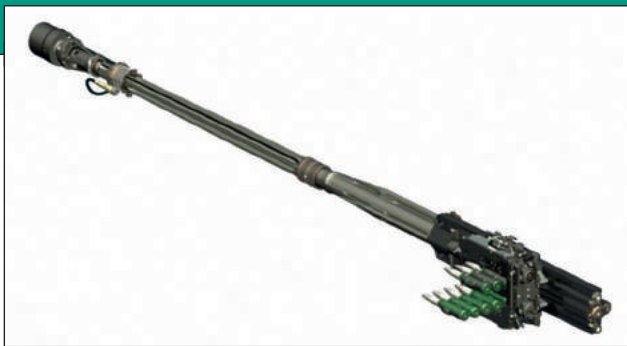
21. ábra. Az MK30-2 ABM 30 mm-es gépágyú

nyokba szerelt verzióval, annak részletes ismertetése Ocskay István: A Puma lánctalpas harcjármű rendszeresítésének útja a Bundeswehrben című tanulmányának II. részében (Haditechnika 2020/3. szám 54–59. oldalán) olvasható. Csak az összehasonlíthatóság érdekében álljon itt a fegyver főbb jellemzőit összefoglaló táblázat.