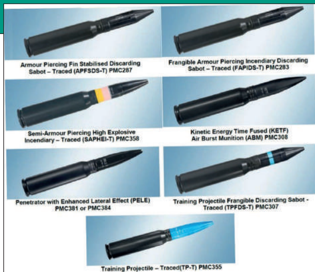
23. ábra. 30 × 173 mm-es, alkalmazásra javasolt géppágyú-lőszer

A Lance tornyokba telepített párhuzamosított fegyverek többféle típusal is kompatibilisek, így az MG3, MAG58 és PKT géppuskák is illeszthetők a géppágyúhoz. A párhuzamosított géppuska málházott alap lőszerkészlete 500 db lőszer, amelyen felül további 200-300 db lőszer helyezhető el a harcjármű küzdőterében.