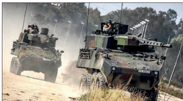
20. ábra. A MOWAG Piranha IIIC kerek harcjármű Lance toronnyal, a spanyol tengerészgyalogság állományában

alternatívaként jelentkezhethetne egy moduláris torony megjelenése, amelynek mérete, tömege, a hordozójárműhöz skálázható. Ez volt az MTS 16 Lance torony, amelyet a közepes és a nehéz harcjárművek számára terveztek, alapvetően 30 mm-es géppágyúval szerelve. Az úrméretváltásnak is volt jelentősége, hiszen a korábbi nyugati típusokban rendszeresített, jellemzően 20-25 mm-es géppágyúk és az azokhoz tartozó lőszerük pusztító hatása, páncéltűtő képessége, a missziós tapasztalatok alapján már nem volt elegendő az ellenség által alkalmazott harcjárművek védtettségével szemben. Ennek megfelelően az MTS Lance toronyba is a már bevált, és a kezdeti nehézségeken túljutott MK30-2 géppágyút építették be, bár maga a torony mérete és kialakítása lehetővé teszi más, 20–40 mm közötti géppágyúk beszerelését is. Párhuzamosított géppuskaként a jól bevált 7,62 mm-es géppuskát választották, valamint a harcokocsik és más páncélozott célok leküzdésére lehetőség volt páncéltörő rakéta integrálására is.