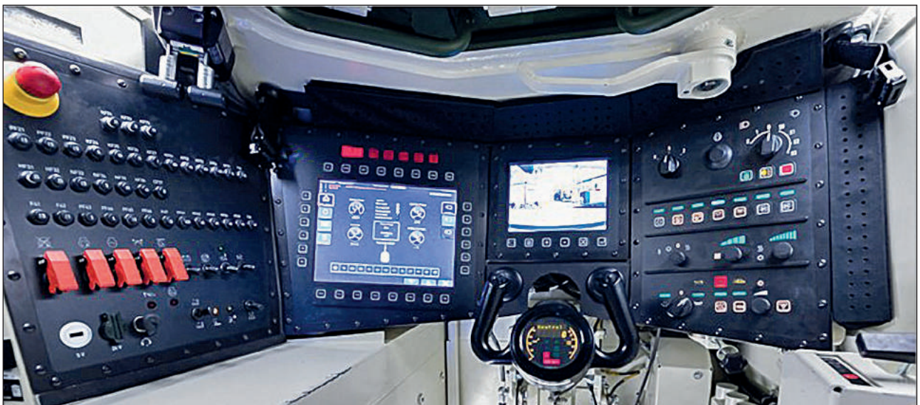
18. ábra. A harcjárművezető munkahelye a KF41-esben

A KF41-es harcjármű kihajtóművei is a Renk AG vállalat termékei. Érdekességük, és a logisztikai ellátás szempontjából kedvező, hogy a jobb és a bal oldali kihajtóművek csereszabatosak egymással. A kihajtóművek gyorsan old-