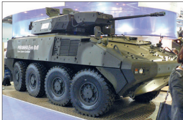
19. ábra. A MOWAG Piranha Evo 8x8 harcjármű Lance toronnyal

A Rheinmetall AG, nagy hagyományokkal rendelkező fegyvergyártó vállalatként, még 2006-ban megkezdte egy olyan közepes toronyrendszer kifejlesztését, amelyre az általa végzett piacfelmérés alapján az akkori harcjárműveknek szükségük lehetett. Úgy gondolkodtak, hogy mind a kelet-európai, mind a nyugati harcjárművek elodázhatatlan fejlesztések elé néznek, illetve az új harcjárművek részére is