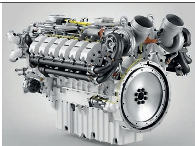
15. ábra. A Liebherr D9512, valamint D9612 típusú motor, mint a KF31-es és a KF41-es gyalogsági harcjárművek erőforrása

a tagolt, átszeldelt terepen végrehajtott menetek esetén is. Az üzemanyag-tartályokat a küzdőtér két oldalára, a jármű külső oldalpáncéljára szerelték fel, meggátolva, hogy robbanás esetén a tűz a küzdőtérben égési sérülést okozhasson. Ez az építési megoldás jellemző a járműben alkalmazott többi munkafolyadék, robbanóanyag és lőszer tárolása esetében is. A motor hűtőrendszere a harcjármű farpáncélján bal és a jobb oldalon elhelyezett 2 db hűtőből áll, amely kialakítással a tervezők a lehető legalacsonyabb infravörös kibocsátást, az optimális ballisztikai védelmet és a megfelelő súlypontot kívánták elérni.