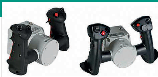
24. ábra. A hagyományos (balra) és a felhasználóra optimalizált (jobbra) kialakítású irányzó tömbök a KF41-es harcjárműből

Mind a toronyforgatás, mind a fegyveremelés maximális sebessége 60°/perc értékű. A száloptikai lézergiroszkópok nem tartalmaznak mozgó alkatrészeket és hasonlóan a rendszer többi eleméhez, beépített ellenőrző rendszerrel rendelkeznek. Az alkalmazott HMI 26 -ek követik a kor elvárásait, tervezésüknél figyelembe vették a „célközönseget”, ennek megfelelően a Lynx KF41 harcjármű irányzó tömbjének kialakítása a számítógépes kontrollerekhez hasonló kialakítást tükröz. A hagyományos és a korszerű követel-