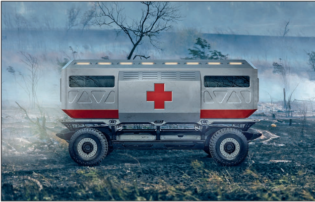
2. ábra. A SURUS-platform egyik lehetséges alkalmazása – önjáró sebesültszállító

Valószínűleg az említett okok magyarázzák, hogy a hadseregek általános felhasználású közúti járművei között még elhanyagolható a részben vagy egészben villamos hajtásláncú (ideértve a hidrogént tankoló elektromos motorral szerelt eszközöket is) gépjárművek aránya. Ugyanakkor nyilvánvaló, hogy a következő években egyre több és többféle villamos jármű megjelenésére számíthatunk a közutakon. Ez egy olyan globális trend, amely hatással van a védelmi szférára is, így már a közeljövőben várható, hogy zöldre festett, elektromos meghajtású katonai járművek jelenjenek meg az utakon. A távolabbi jövőben a speciális szárazföldi járművek, a harcjárművek is áttérnek az elektromos meghajtásra, napjainkban már ezen a területen is folynak kutatások.