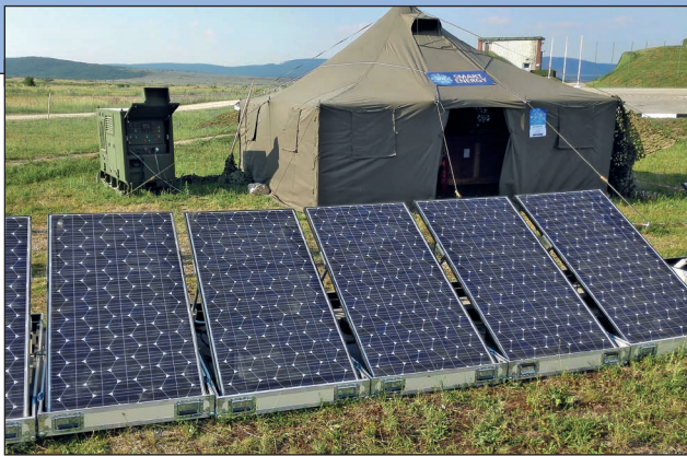
5. ábra. Napelemek és dízelaggregátor egy logisztikai gyakorlaton

a katonai egységek az aggregátorok üzemeltetésére a harc- és gépjárművektől eltérő üzemanyagot használnak, hiszen ez ugyanúgy utánpótlást igényelne, ráadásul a NATO-ban él az ún. „Egyetlen üzemanyag elve” (SFC) [6] 12 , vagyis a logisztikai ellátás egyszerűsítése érdekében a harctérre kizárólag szabványos összetételű kerozint 13 szállítanak, és minden hőerőgépet azzal kell üzemeltetni.