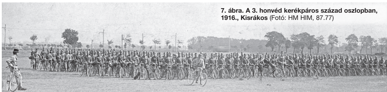
7. ábra. A 3. honvéd kerékpáros század oszlopban, 1916., Kisrákos