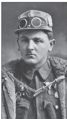
14. ábra. Kerékpáros honvéd ügyességi jelvénnel és általános rohamcsapatjelvénnel 1918-ban

1918. július 1-én beosztottak a zászlóalj mellé egy géppuskás századot, ugyanakkor minden kerékpáros század IV. szakaszát géppuskássá szervezték 4 szabványos géppuskával 39 (a kerékpáros zászlóalj kerékpáros századainak egy szakasza még az 1920-as években is géppuskás szakasként szerepelt 40 ). A kerékpáros pótszázad állománya – amelynek elérésére a szabályok szerint minden hónap 1-re törekedni kellett – így a következőképpen módosult: 7 tiszt, 20 altiszt, 180 honvéd, a géppuskás pótszázadé 6 tiszt, 12 altiszt, 60 honvéd. 41