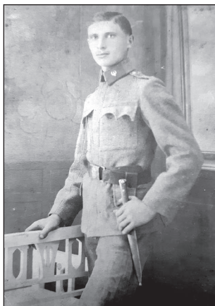
11. ábra. A katonai zubbony gallérján a kerékpáros csapatnemi jelzés látható

amelyeket beolvasztottak a kerékpáros vadászászlóaljba, valamint a megalakuló honvéd kerékpáros zászlóaljba. A két zászlóaljból ugyanakkor egy-egy régi századot kiemeltek, és egy harmadik újonnan szervezett önkéntes kerékpáros századdal megerősítve megalakították a 2. kerékpáros vadászászlóalját. 35