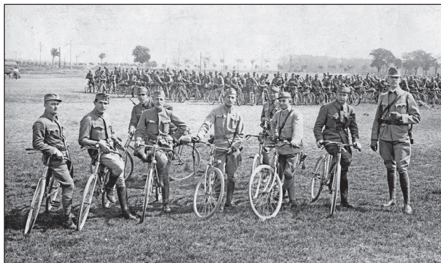
13. ábra. A 3. honvéd kerékpáros század tisztikara, 1916., Kistrákos

lakosok lesznek.” 36 1918. február 28-tól a felállított póttosztag hivatalosan is pótszázaddá alakult 37 a budapesti I. honvéd kerületi parancsnokság alárendeltségében, váci székhellyel. A megalakuló pótszázad részére 150 gyakorló kerékpárt utaltak ki, valamint a javításhoz szükséges műhelyfelszerelés kiutalásáról is intézkedtek. Állománya 15 tiszt, 45 altiszt, 420 honvéd, a géppuskás pótszázadé 5 tiszt, 10 altiszt, 50 honvéd. 38 A pótszázad 1918. 04. 21-én Kiskunfélegyházára települt át, ahol – közvetett adatok szerint – a háború végéig állomásoztak.