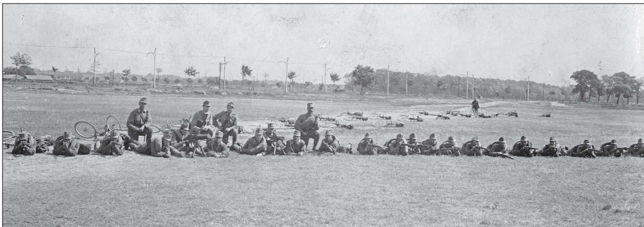
15. ábra. Kerékpáros géppuskás szakasz rajvonalan, 1916., Kisrákos