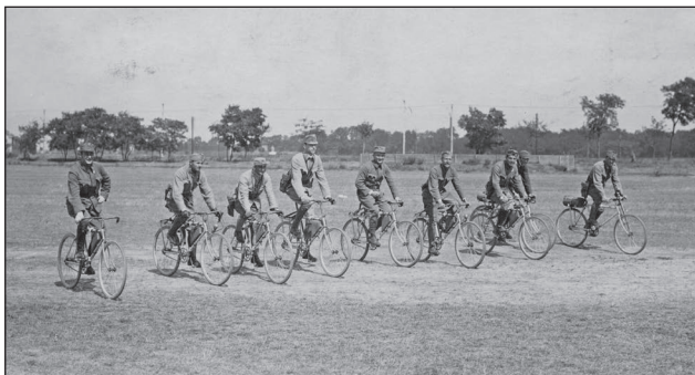
8. ábra. Kerékpáros kiképzés, 1916., Kisrákos

Agyak: mind az első, mind a hátsó kerék részére tömör acélrúdból gyártva, csereszabatosak, a hátsó kerék tenge-