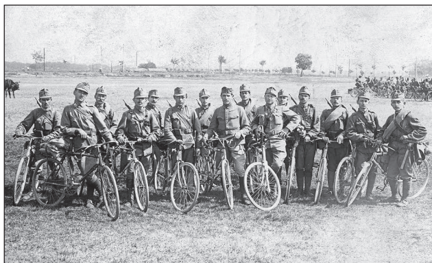
12. ábra. A 3. honvéd kerékpáros századhoz vezényelt 1. honvéd gyalogezredbeli honvédek csoportja a kistrákos gyakorlótéren, 1916.

A harctéren tartózkodó önkéntes kerékpáros al egységekből 1918 januárjában két önkéntes kerékpáros századot szerveztek,