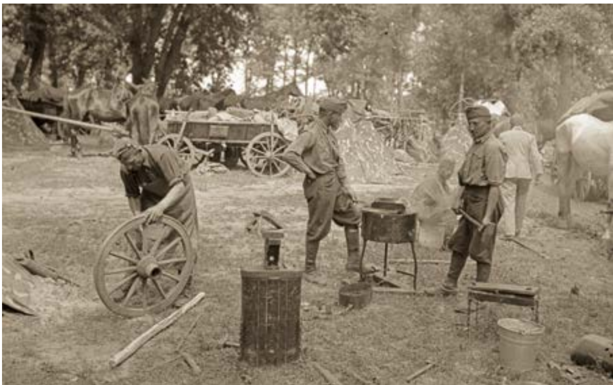
26. ÁBRA. A dandár kovácsműhelye

Mivel az 1. lovasdandár a hadtest tevékenységi sávjából kiszorult, a harcok befejeztével az élcsapatoktól több mint 50 kilométerre lemaradva, részeivel a Dzurin körzetében történő begyülekezést és az állományrendezést kapta másnapi feladatuként. A harcok során elszenvedett nagyarányú lövészettség miatt a hátsó nélkül maradt huszárokból gyalogszázadokat alakítottak, és a további harcok során így alkalmazták őket.