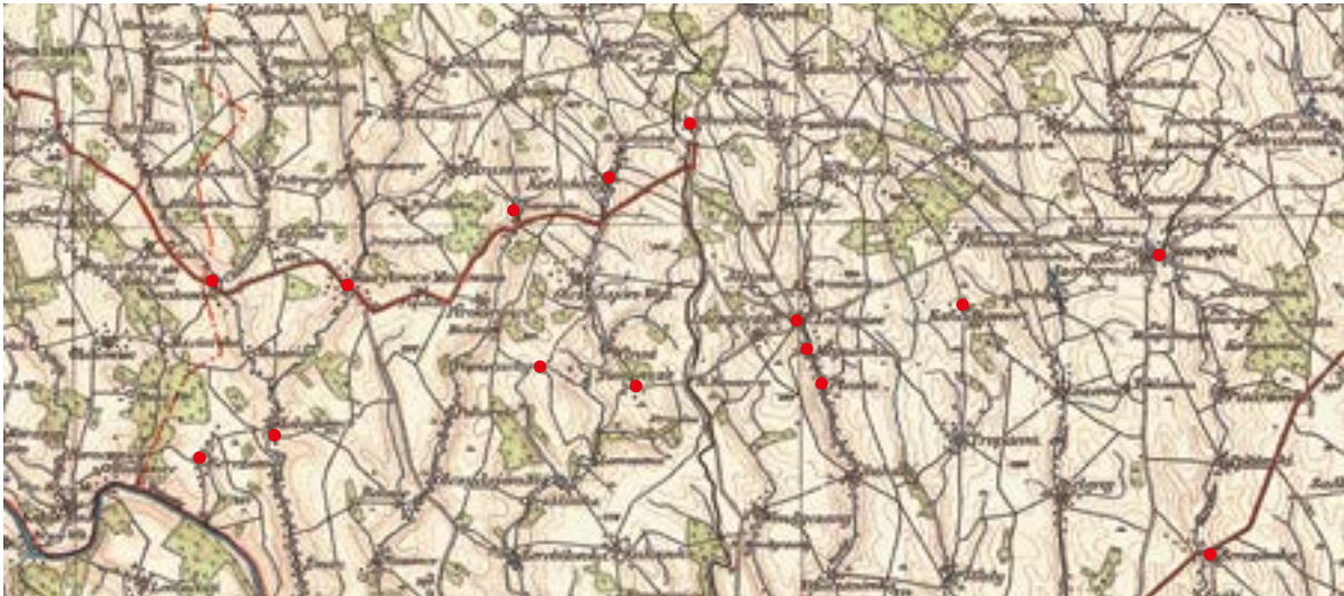
25. ÁBRA. A harctevékenység körzete 1941. 07. 20–22. időszakban. Térképrészlet (Forrás: HIM. A német haderő 1:30000 térképe, Sonderausgabe 7.40 U 49 Kameniec Podolski, 1941.)

tett meg a lovasság korszerű alkalmazása. Nevezetesen: „széles arcvonalon szétbontakozottan támadva, az ellenség puhapontjainak kitapogátása, ennek felismerése után kíméletlen erőösszevonás e gyenge pont ellen, más arcvonalszakasz rovására; gyors és meglepő irányból való támadás ott, ahol a helyi súlyképzés lehetséges; ellenséges túlerő ellen szétszórt csoportokban való védelem, váltakozva a kedvező irányból végrehajtott támadással – ami mind végeredményben nem más, mint a hagyományos lovas szellemmel végrehajtott ősi magyar lovas harceljárás korszerűsített köntösben”. [56; 25. o.]