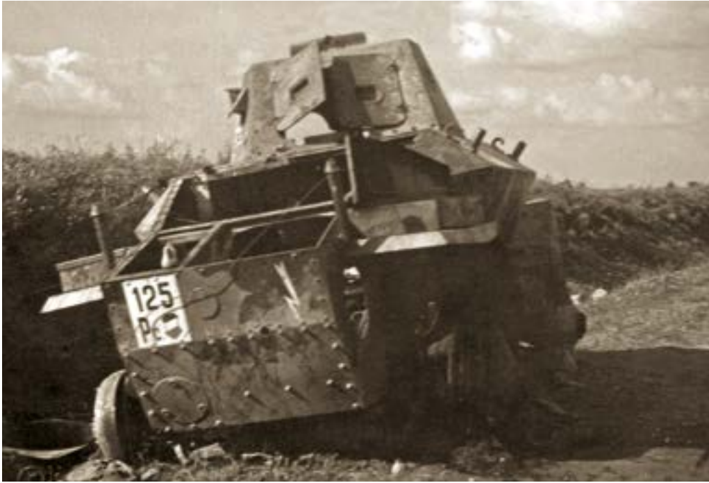
28. ÁBRA. Kilőtt magyar 39M Csaba felderítő páncélgépkocsi 1941 júliusában, Rogoszna körzetében

Az 1. gépkocsizó zászlóalj az előtte lévő erők elleni támadás felújítását kapta feladatul Uliga, Uliska ( Ulyshka ) területéről annak érdekében, hogy kivesse a szovjet erőket az állásaikból. A parancs kiadása után a dandárparancsnok a vezérkarfőnökkel együtt előre ment az 1. zászlóaljparancsnokhoz, hogy tájékozzódjon a harc menetéről.