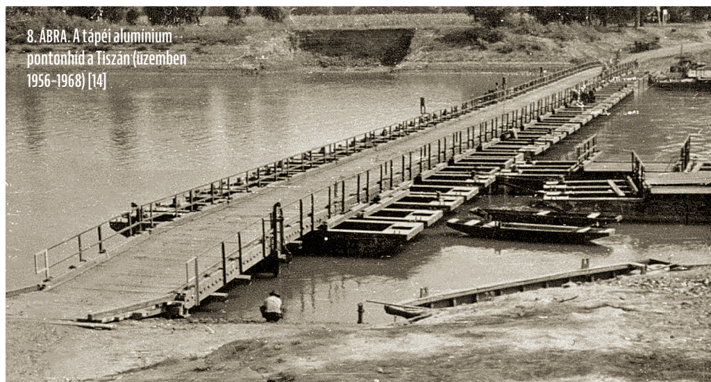
8. ÁBRA. A tápéi alumínium pontonhíd a Tiszán (üzemben 1956-1968) [14]

A BMK-130 jelű motorcsónakot a tiszadobi üzem igényeihez alakították át. Lebontották a mankókerekeit bedobozolva azok fészkeit, javítva a hajótest áramlási tulajdonságait. Így a motorcsónakot azonban már nem lehet segédeszköz nélkül kiemelni a vízből, ezért egy külön utánfutót készítettek segítségül a téli és karbantartási partra vételhez.