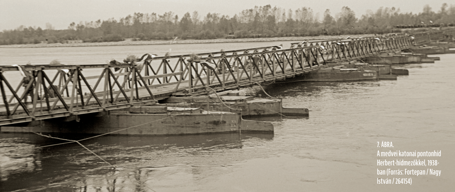
7. ÁBRA. A medvei katonai pontonhíd Herbert-hídmezőkkel, 1938- ban

A BMK-130-as motorcsónak a pontonhíd működésének legfontosabb eszköze. 2004-ben a pontonhíd üzembiztonságát átvizsgálva ezért egy tartalék hajó rendszerbe állítását tűzték ki célul, hogy az üzemelő, koros BMK-130 bármilyen meghibásodása esetén rendelkezésre álljon egy alternatív elérhető eszköz. A tiszadobi pontonhíd üzemnek ebben a Magyar Honvédség nyújtott segítséget, amely térítésmentesen adott át egy selejtezett BMK-130 motorcsónakot a hidat üzemeltető Magyar Közút számára. E második motorcsónakot a hídkezelők igyekeztek a legnagyobb körültekintéssel felújítani, és levizsgáztatni a korábbiakhoz képest lényegesen szigorúbb hajózási előírások szerint. A hajó teljesen új motort és hajtásrendszert kapott. Az eredmény egy katonai célú hajótestbe bújtatott finom gépészet lett.