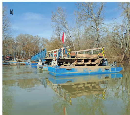
3. ÁBRA. A tiszadobi pontonhíd közbelső kilenc nyílásának keresztmetszete (a hajózónyílás csatlakozásánál, nyitott állapotban) b) és műszaki rajza a) (A szerző felvétele és szerkesztett rajza)

felett 9 db, nyílással lefelé fordított 200×50×8 mm-es alumínium U-szelvényű hossztartó tartja. A hídon végig egyrétegű, 2"-os keresztirányú keményfa palló burkolat található.