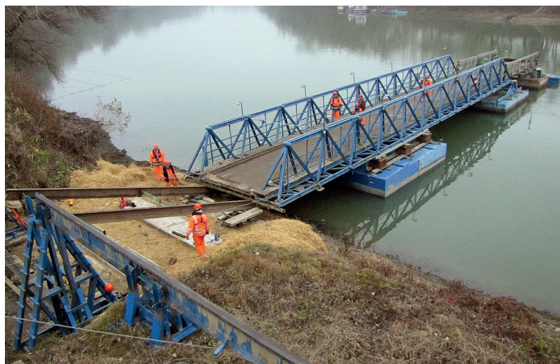
6. ÁBRA. A jobb parti Herbert-nyílás pontonokra csúsztatása a segédgerendákkal [7]

Az alumínium-ötvözetek vitathatatlan előnyeik ellenére nem váltak be, ezért a kifejlesztett magyar alumínium hadihíd nagyon rövid ideig volt támogatott elképzelés. Alig fél