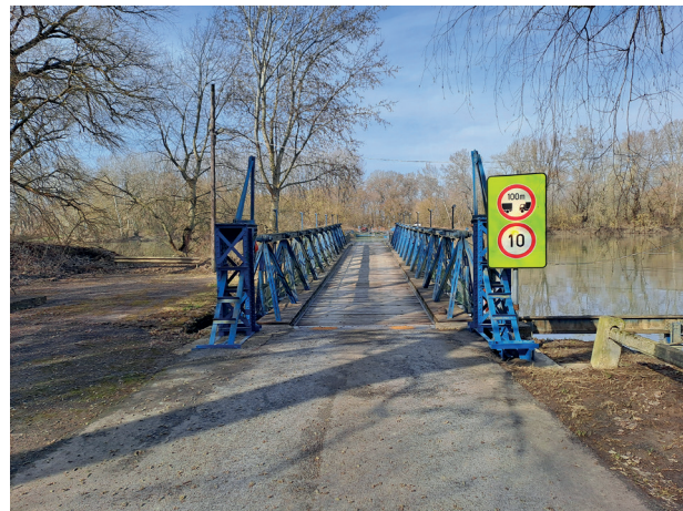
2. ÁBRA. A tiszadobi pontonhíd kocspálya nézete Tiszadob felől 2014-ben