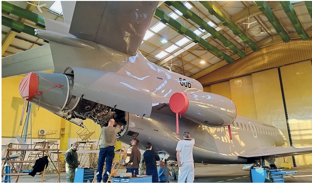
5. ÁBRA. Karbantartás a kecskeméti repülőbázison

majdnem minden pontján teljesítettek már feladatot.