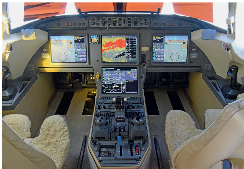
3. ÁBRA. A Falcon 7X pilótafülkéje [23]

A repülőgép 28 V-os egyenáramú rendszerrel működik (ez szükséges az elektromos és avionikai berendezések működtetéséhez), amelynek táplálását a három fő-, valamint a segédhajtómű generátorai, illetve a földi áramforrás (GPU – ground power unit) biztosítja. Vész helyzetben – például, ha teljesen megszűnik az elektromos táplálás, leáll mindhárom hajtómű vagy meghibásodik az összes generátor – a törzs elejében rendelkezésre áll egy áramfejlesztő turbina, amelyet használatkor ki lehet