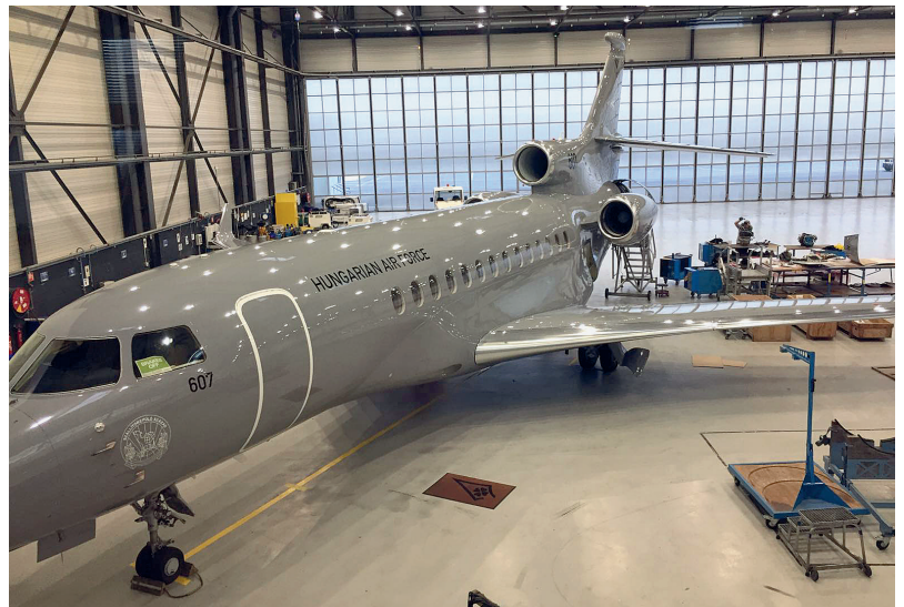
7. ÁBRA. A 607-es oldalszámú repülőgép karbantartása a Dassault Falcon Service párizsi telephelyén (A szerző felvétele)

A Dassault Falcon 7X napjaink széles körben ismert és használt üzleti repülőgépe, amelyet a világ számos pontján rendszeresítettek a haderőkben is. A típus kivitelezését, az alkalmazott technikai megoldásokat tekintve a 21. század terméke, először a 2001-es Paris Air Show iparági kiállításon mutatták be. Hasonlóan más üzemben tartók véleményéhez, a magyar katonai üzemeltetési tapasztalatok is pozitívak. A gyártói fejlesztések azonban nem álltak meg a 7X/8X típusoknál, ékes példája ennek a Falcon 6X, amely az EASA/FAA (European Union Aviation Safety Agency/Federal Aviation Administration – az Európai Unió Repülésbiztonsági Ügynöksége/ az USA Szövetségi Légiközlekedési Hivatala) légialkalmassági engedélyét 2023 augusztusában szerezte meg [19], így egy újabb változattal bővült a típuscsalád. A jövőt a még tervezés és kivitelezés alatt álló Falcon 10X képviseli, amely a maga méreteivel, kényelmi funkcióival és 13 890 km-es hatótávolságával [20] kategóriájában egyedülálló repülőgép lesz. ■