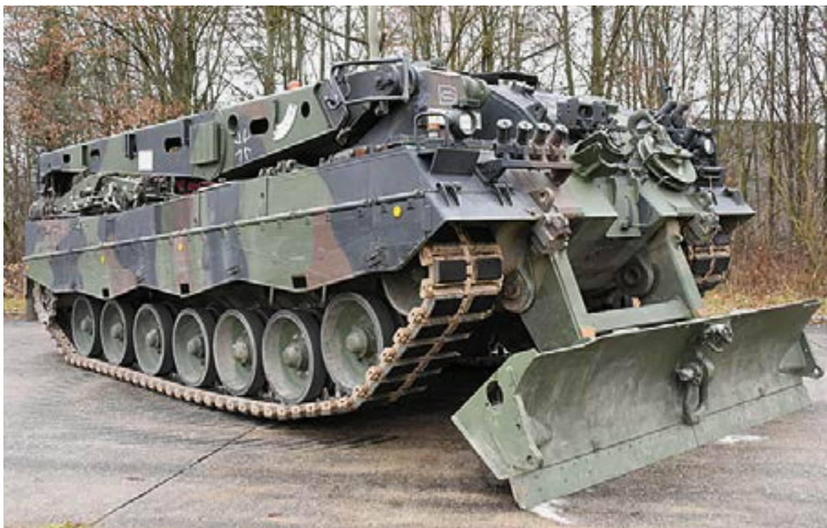
30. ÁBRA. A Bundeswehr Bergepanzer 3A0A1 „Buffel” letámasztott tololappal [38]

A műszaki-mentő eszközök esetében a gyártók általában az alapjármű adatait ismertetik, a speciális berendezésekkel felszerelt változatok esetében az adatok hiányosak, hiszen fejlesztésük – a hadműveleti követelmények változásának függvényében – folyamatos. [39]