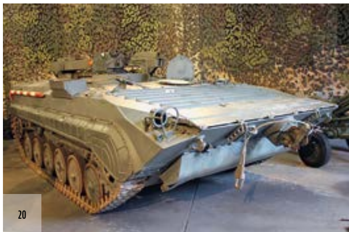
20. ÁBRA. VPV lánctalpas vontató a Hadtörténeli Intézet és Múzeum egykori Lehel úti logisztikai szakgyűjteményében [22]