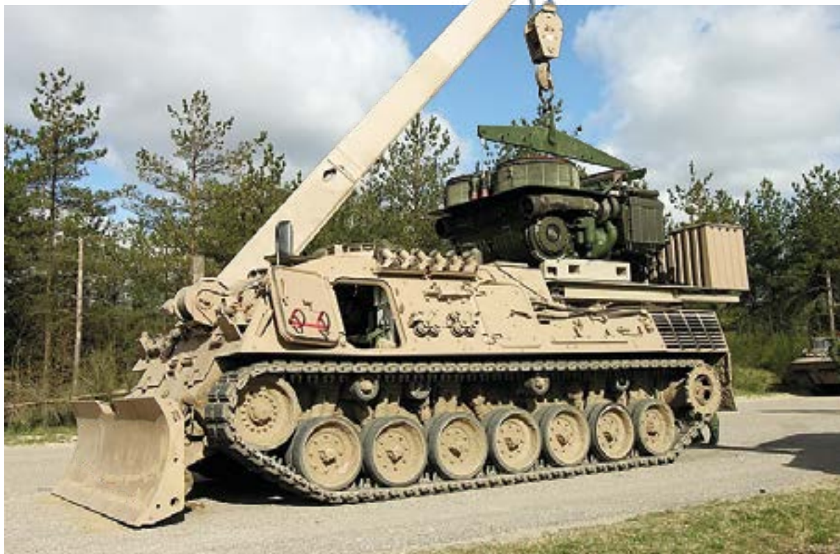
26. ÁBRA. Wisent 1 a motor- és erőátviteli blokk emelése közben [32]

A harmadik változat az aknamentesítő kialakítás (Mine Clearing – MC), amely a jármű teljes szélességében elvégzi a mentesítést, és sávjelző rendszert is képes telepíteni.