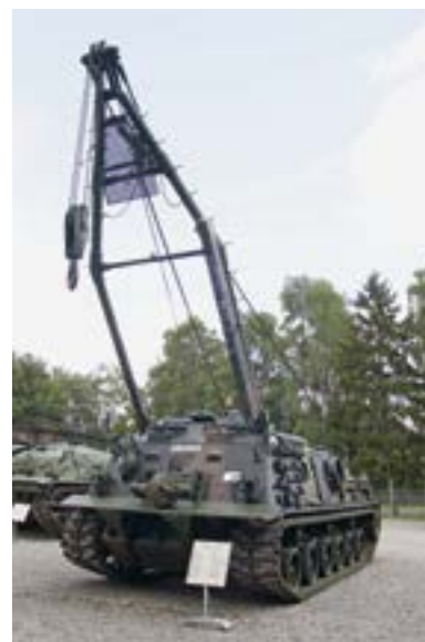
23. ÁBRA. A német M88 ARV (Armored Recovery Vehicle, Bergepanzer 1) műszaki-mentő a németországi Deutsches Pansermuseumban, Münsterben [28]

gákat, kengyeleket, pótlánc tagokat, emellett a fedélzeti 360 A áramerősségű hegesztő-vágó berendezés is a műszaki mentést szolgálja. Az eszköz megfelelő előkészítés után víz alatti átkelésre is képes. A küzdőtér közepén található, két hidromotorral hajtott főcsörlő kábeldobjának maximális húzóereje 350 kN, de a járművön kívülre szerelt csiga használatával a húzóerő megduplázható 700 kN-ra. A kötel munkahossza 90 m. A járműtest jobb oldalán elhelyezett daru 270°-os szögben elforgatható, teherbírása kitámasztóval, maximális 72°-os géállásnál 20 t. A gémmelését süllyesztését hidraulikus munkahenger végzi. A két hidraulikus munkahengerrel működtetett tolólapp 3250 mm széles, amelyet csörlőzészor és daruzáskor a vontató megtámasztására, stabilizálására alkalmaznak, de talajgyengítésre, fedezék építésére is alkalmas. [30]