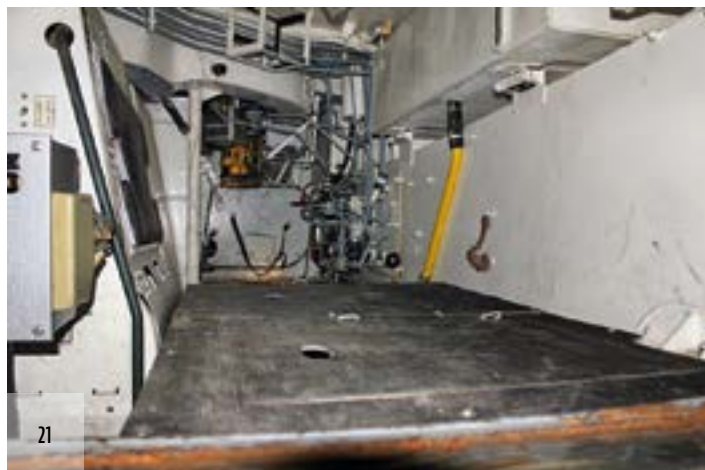
21. ÁBRA. A VPV szállító-/ rakodótere [22]

ürítő vízszivattyú távolítja el. A motor vízütés elleni védelmét egy automatikus zárószelvény rendszer biztosítja a motor leállása esetén, de a rendszer kézzel is működtethető.