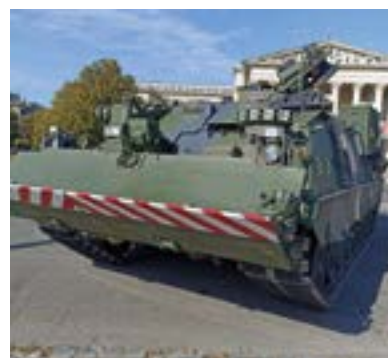
28. ÁBRA. A PzB 3 Buffel tololapja menethelyzetben

ellen 4. szintű (Level 4) védelmet biztosít az alábbi eszközök ellen: