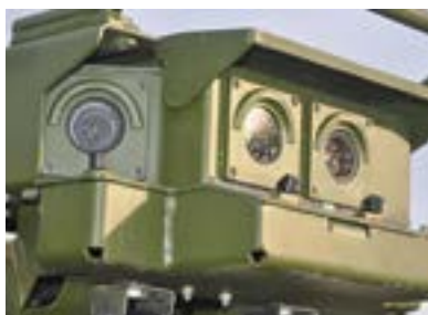
29. ÁBRA. Kappa optronics kamera páncélvédelemmel, lecsukható védőfedéllel [34]

kíméli, harctéri körülmények között csökkenti a hang- és füst kibocsátási hatást. A műszaki-mentő jármű oldalán egy önálló dízelüzemű generátort helyeztek el, amely táplálja a lítium bázisú energiatárolót (Auxiliary Power Booster – APB). Az energiatároló háromféle üzemmódban – kis, közepes és nagy – teljesítménnyel működtethető. A kis teljesítményű üzemmód esetén a tárolt energia 9,6 kWh, közepes üzemmódban 12,8 kWh, a nagy teljesítmény esetén 19,2 kWh. A tároló érzékelőrendszere mindenkor biztosítja a dízelmotor beindításához szükséges energiát.