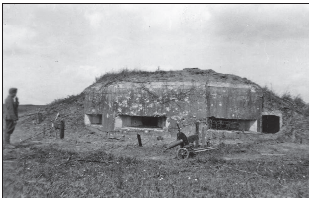
17. ábra. A Sztálin-vonal egyik géppuskás erődje

1941-ben – az ún. Barbarossa hadművelet 16 keretében – a magyar királyi I. gyorsadtest két (páncélozott) felderítő-zászlóalja – július 9-től a német Dél Hadseregcsoporthoz alárendeltségében – részt vett a Szovjetunió elleni hadműveletben. Hat nappal később a gyorsadtest seregtestei az előző nap elfoglalt körleteikben csapatát-csoportosítást és karbantartást hajtottak végre, valamint kiegészítették a készleteiket. A várható feladatok ellátására igényelt nagy mennyiségű szállítmány, a pécsi IV. tehergépkocsi osztály 1. és 2. szállítóoszlopával – a szállítókapacitás hiánya és az utak állapota miatt – csak július 18-án érkezett meg Kolomijába. A csapatok a hamarosan kezdődő támadásra készültek.