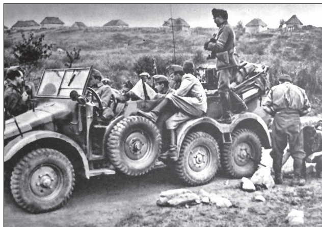
19. ábra. Felderítő zászlóalj parancsnoka és törzse menet közben értékeli a kapott felderítési adatokat [39; 72. o.]

és így is csak 19-én hajnalban érkezett a városba. [42; 128–129. o.]