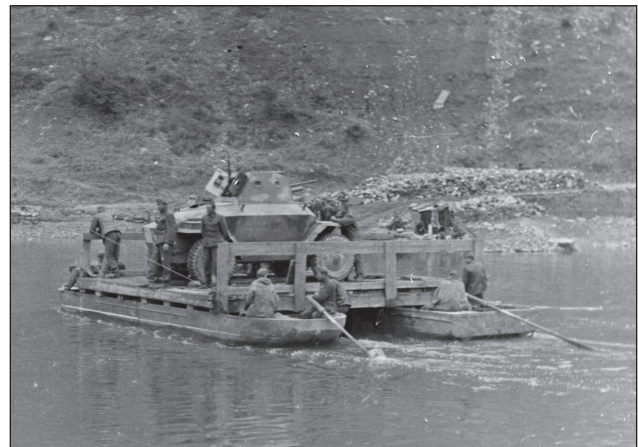
8. ábra. Az 1. lovasdandár páncélgépkocsi századának Csaba páncélgépkocsijának áthajózása a Dnyeszteren

A dandár három lépcsőben tervezte a milhalcei hadihídon történő átjutást. Az első lépcsőjében a páncélgépkocsi század, majd a 13. kerékpáros zászlóalj és a 3. gépkocsizó utászszázad haladt. A második lépcső a lovas alakulatokból, míg a harmadik a kerékpáros, a gépkocsizó és a páncéltörő részekből állt. [21; 117. o.] Amikor a második (lovas) lépcső a hírhoz ért, a Kárpátokban lezúduló esők miatt megáradt hegyi patakok miatt hirtelen megemelkedett a Dnyeszter vízszintje. Az áradás miatt a dandár második lépcsőjének mindössze a fele tudott átjutni a túlpartra. A hömpölygő víz a hidat is veszélyeztette. A híd átépítése – a lovasdandár katonáinak segítségével – délutánra ké-