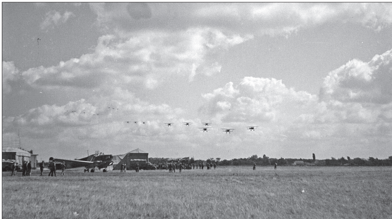
12. ábra. Weiss Manfréd gyártmányú WM-21 Sólyom közelfelderítő repülőgép-kötelék a szovjet fronton

Július 12-én a felderítő-repülők Dunajovciről és Zvancsikról a Minkovciba tartó úton ellenséges összefüggő gépkocsizó és fogatolt menetoszlopokat derítettek fel. A hadtestparancsnok elrendelte a visszavonuló erők bombázását. A repülőcsoport parancsnoka a feladatra a harcászati szintű bombázás végrehajtására is alkalmas VII. közelfelderítő század gépeit rendelte ki a 2. és 3. vadászszázad gépei kíséretével. Ezzel egyidőben a 2. gépkocsizó dandár előrenyomuló oszlopa ellen egy szovjet bombázó raj vonult fel. A magyar kísérő vadászok megtámadták a szovjet bombázókat oltalmazó vadászokat, és öt darab I-16 Rata vadászgépet lelőttek. Saját légierőben csak egyetlen gépvesztés történt, de a pilótát a két harcvonaltól a 5. gépkocsizó zászlóalj katonái sikeresen kihozták. Ezzel a magyar repülőknél sikerült egy rövid időre a helyi légi uralmat kivívniuk. [22; 25–26. o.]