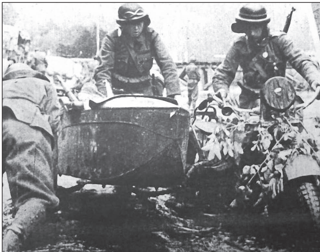
9. ábra. A felderítő-zászlóalj motorkerékpáros járőre birkózik a sárral

vetett egy ellenséges szakaszt a biztosító állásából. A kiküldött járőrök jelentették, hogy az út Sztanyiszlavovka ( Stanislawowka ) község után nem járható, ezért Kitajrod ( Kitajród ) felé egy másik, megkerülési útvonalat derítettek fel. A nap végére a felderítőjárőr csoport tagjai a Sztugenyica patak mentén szétbontakoztak; többségük Kitajrodnál éjszakázott. Ezzel egyidőben a dandár nagy többsége már Kamenyec-Podolszkij körzetében, a szállásra kijelölt körletben gyülekezett.