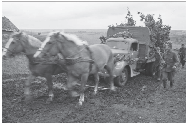
11. ábra. Lovak vontatta magyar teherautó a fronton

A beérkező felderítőosztag harccal megtisztította Zvancsikot a még ott lévő szovjet járőrállománytól, és a többi kiküldött felderítőegység is felvette a harcot az ellenséges biztosító erőkkel. Az 1. felderítőosztag a Tarnava patakon átkelve elérte a Kitajgrad község melletti magaslatokat, majd egy szűk völgykatlanon átjutva, egy visszavonuló szovjet gépkocsioszlopot derített fel. A felderítőosztag az oszlopra tűzrajtaütést hajtott végre, és visszazavartotta a szovjet erőket. Az elmenekült ellenség mintegy 100-150 darab gépkocsit, ép lövegeket és gépjárműre szerelt ikergéppuskákat hagyott hátra. Azonban az utóvédek kihasználva a terep adta lehetőségeket, kisebb ellenlökések végrehajtásával továbbra is lassították és feltartóztatták a gépesített csapatok előrenyomulását. [21; 119. o.]