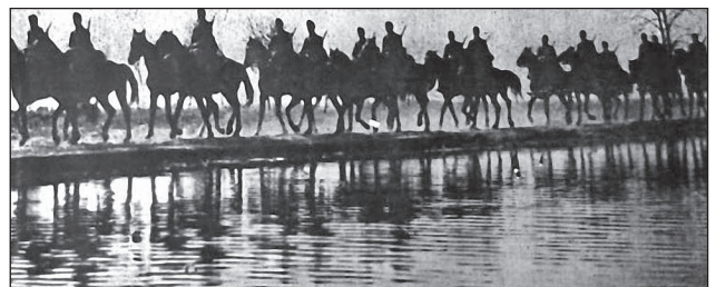
10. ábra. A felderítőosztag kiküldött lovas felderítő-járőre

A 2. felderítőosztágot Schwartz alezredes – a 3/I. huszárosztály parancsnoka – parancsnoksága alatt hozták létre. Az állományát a 3/I. 2. huszárszázad alkotta, amely a másik osztagéhoz hasonló megerősítést kapott. A Zvancsik ( Zwanczyk ) környékének felderítésére kiküldött felderítő erők megállapították, hogy a legjelentősebb útcsomópontot a szovjet kötélekek megszállták.