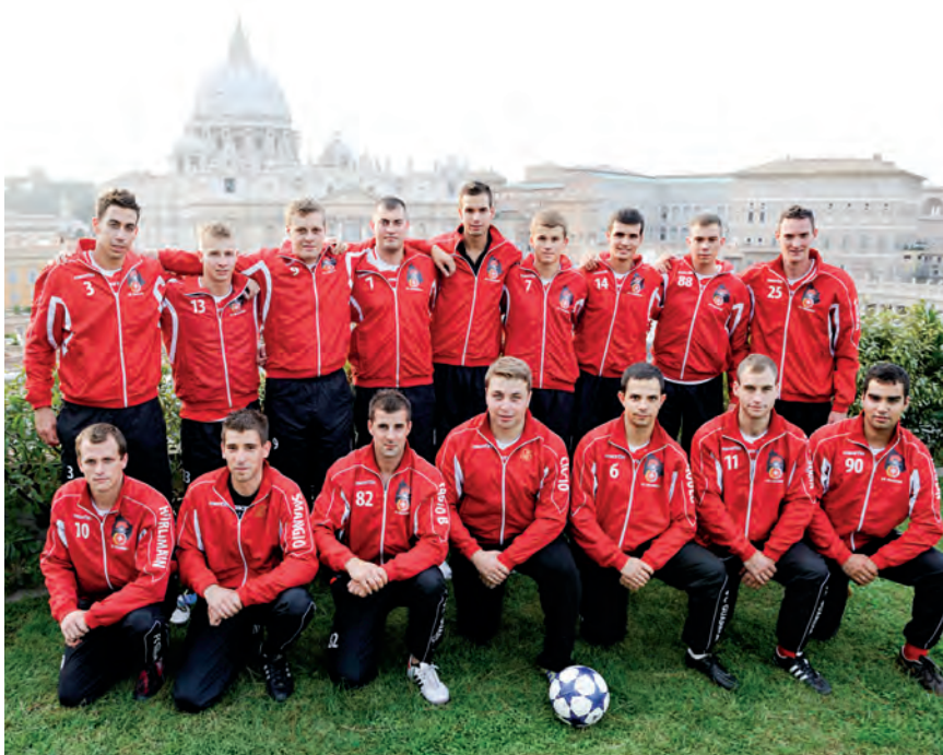
A Gárda focicsapata

– Mindegyik fontos számomra. Meghatározott szolgálati évek után kaptam meg őket, és azóta büszkén viselem mindhármát. Az első kitüntetést, a hivatalos megnevezéssel Benemerenti Cross-t, az első három szolgálati évet követően tűzhettem a zubbonyomra. A következő kereszt, a Pro Ecclesia et Pontifice (Az Egyházért és a Pápáért) hét év