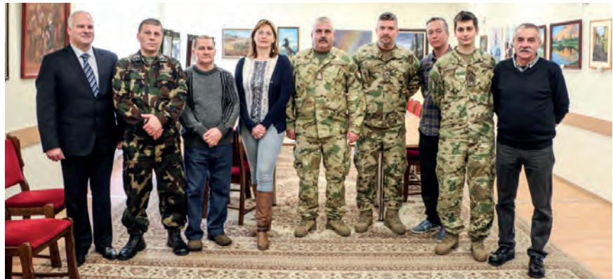
Mednyánszky Kör tagjai laktanyai kiállításon

kiegészítve fejtik ki tevékenységüket. Tagjai aktív és nyugállományú katonák, honvédségi alkalmazottak, a Kratochvil Károly Honvéd Középiscola és Kollégium tanárai és diákjai, középiskolás diákok, művészemberek és civilek. A csoportok a fenti egyesületek közreműködésével és segítségével működnek. A tevékenységi körök különböző társadalmi és kulturális szervezetekkel való együttműködéssel is kiegészülnek.