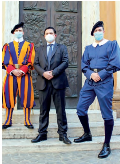
A három testőr: egy mindenkiért, mindenki egyért...

– Különböző megnyilvánulásokat tapasztaltam, hiszen a Pápai Svájci Gárda tevékenységét, szerepét környezetemben, de mondhatom, hogy magában Svájcban sem nagyon ismerték akkoriban. Az emberek tudták, hogy létezik, de nem mindenkinek volt pontos ismerete arról, hogy mit is csinálnak, mi a feladatuk. A családom természetesen büszke volt a választásomra és támogató. Néhány barátom gratulált, mások megkérdezték: Te most akkor pap leszel? A hozzám közel állók többsége miután informálódott a Gárda sajátosságairól, feladatairól, azt mondta: ez a munka határozottan megfelel majd nekem.