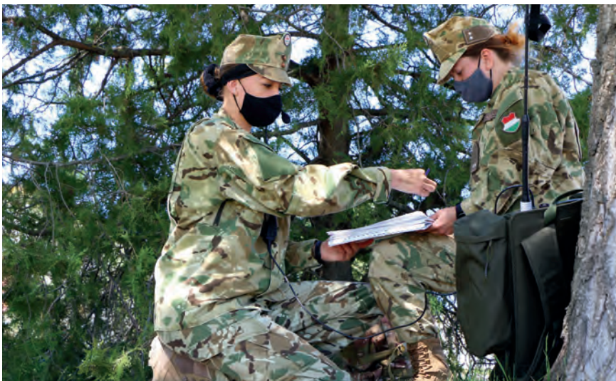
Feladat-végrehajtás az altiszti alaptanfolyam híradó szakmai képzésén