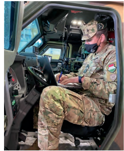
A korszerű technika diagnosztizálása, karbantartása és javítása a gépjárműelektronika terén jártas szakjavító állományt feltételez

A Gidrán harcjárművek fegyverzete maximálisan kielégíti a 21. századi követelményeket, így hatalmas