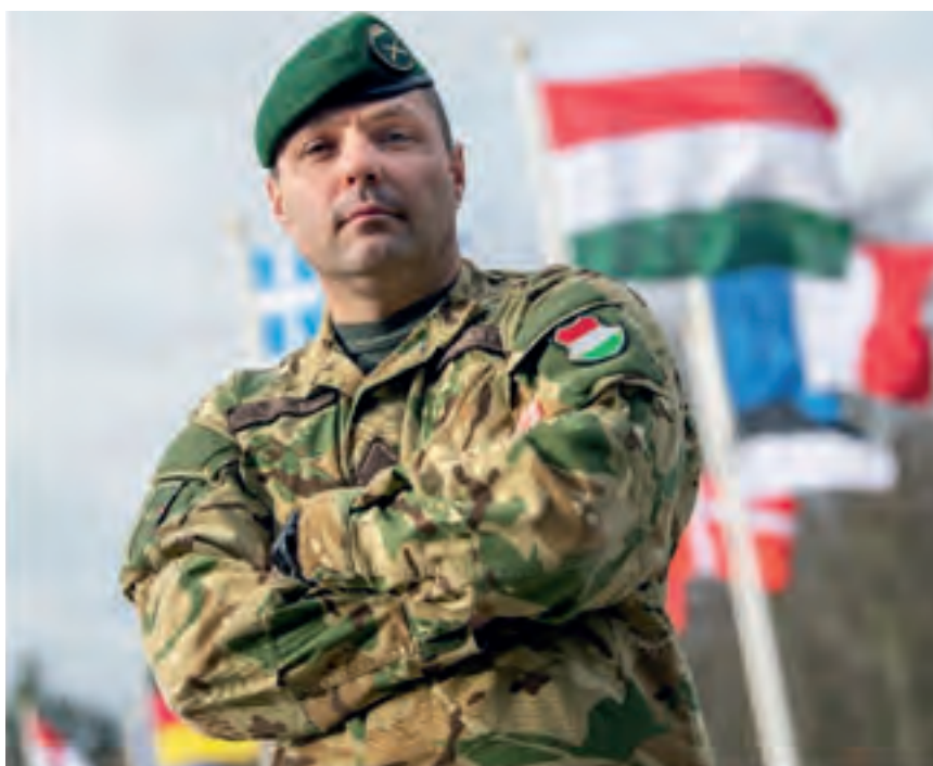
A zászlós jelenleg Hollandiában teljesít szolgálatot

– Jelenleg a Parancsnokság Kommunikációs Igazgatóságának Információs Műveletek Főnökségén egy kis létszámú csoportban dolgozom, egyedüli magyarként. Nem mondom, hogy egyik napról a másikra mindent sikerült elsajátítanom, inkább, hogy ez egy igazi, véget nem érő tanulási folyamat számomra. A csoport feladata a főparancsnokság felelősségi területét lefedő információs környezet folyamatos megfigyelése és értékelése. Mint bármely más katonai alegységnél,