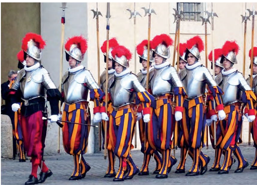
Az alakzat élén

– Újoncként az első feladat az alapképzés végrehajtása volt, amelyet a három operatív szakterület egyikébe történő beosztásba helyezés követett. Itt megéreztem az igazi csapatszellemet, illetve valójában ismételtelen egy újabb család tagjának éreztem magam. A század személyi állománya lehetőség szerint a szolgálattelátás során és a szolgálattelátás időn kívül is keresi egymás társaságát. Ebben a házaspár, illetve a gyermekes gárdisták is partnerek, mindenki azon van, hogy