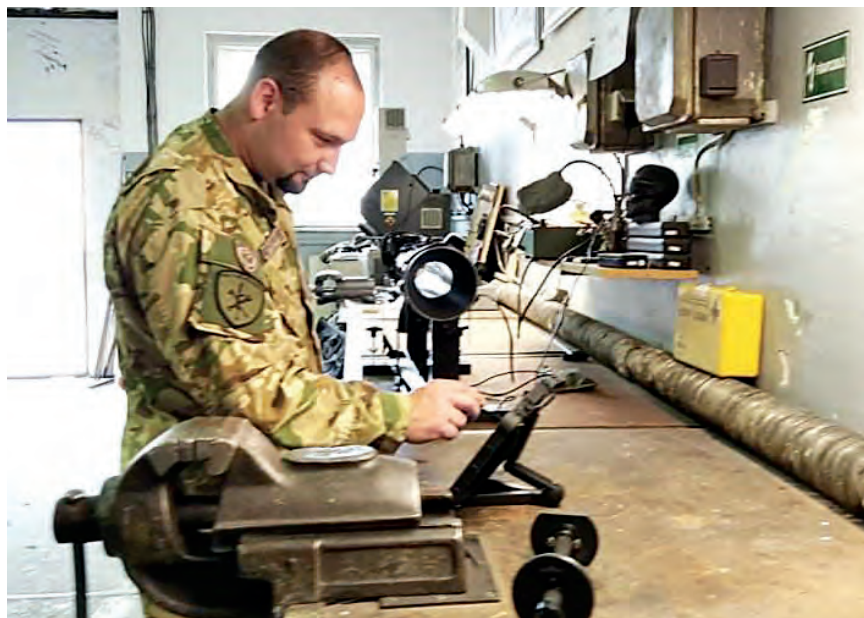
A haderőfejlesztési program a logisztikai területen dolgozókat is komoly kihívás elé állította

„A képzésben történő részvétel egy új kihívás és egyben megtiszteltetés volt számomra. Az elmúlt 13 évben főként a már rendszerben lévő technikai eszközök javítása, kiszolgálása, „életben tartása” képezte a feladataim nagy részét. Ezeknek a technikai eszközöknek (BTR-80, BTR-80/A) a gyártása az 1980-as évek közepén kezdődött meg, így a '90-es években még modernnek számítottak. Kijelenthetem, hogy a két technikai eszköz mind szerkezeti felépítésében, mind felszereltségében szinte összehasonlíthatatlan.