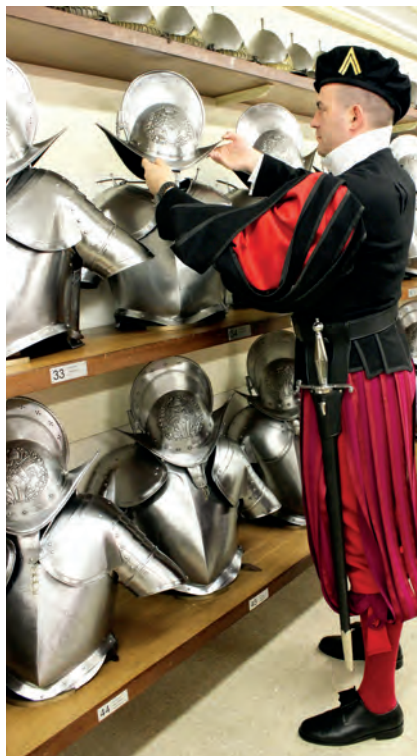
A svájci pontosság és precizitás: minden a helyén legyen...

– Ez egy történelmi látogatás Magyarország számára. Ferenc pápa részvétele a Nemzetközi Eucharisztikus Kongresszus záró-