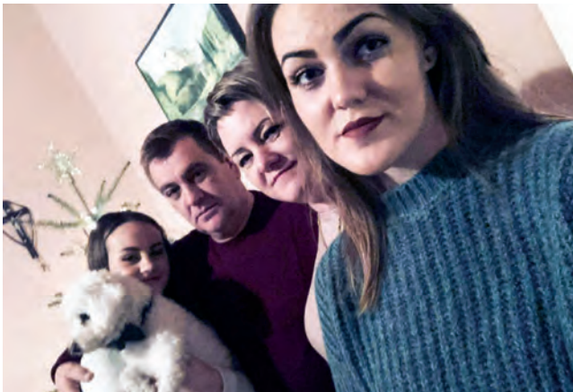
A téti székelyföldi közösség miatt elviselhető a család hiánya