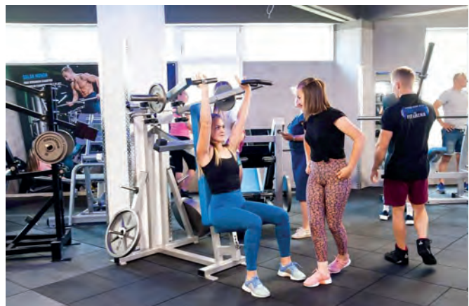
Szabadidőben irány az edzőterem és a teniszpálya

geinek jó lehet, így én is csak arra koncentráltam, hogy minél közelebb lehessenek a családomhoz, ezért azt gondoltam, bármi jó, csak Debrecenben legyen! Gondolkodtam először a katonai zenész irányon is, mivel fuvolázom és szaxofonon is játszom, és a csíkszenttamási fúvószenekar tagja vagyok 2010 óta, sokat turnéztunk Magyarországon is, főleg Téten, a testvérvárosunkban. Elsősorban lövész szerettem volna lenni, mert harcolóként akartam magam kipróbálni. Szentendrén a kiképzőink is Debrecenből voltak, így tőlük első kézből hallhattunk az alakulat életéről.