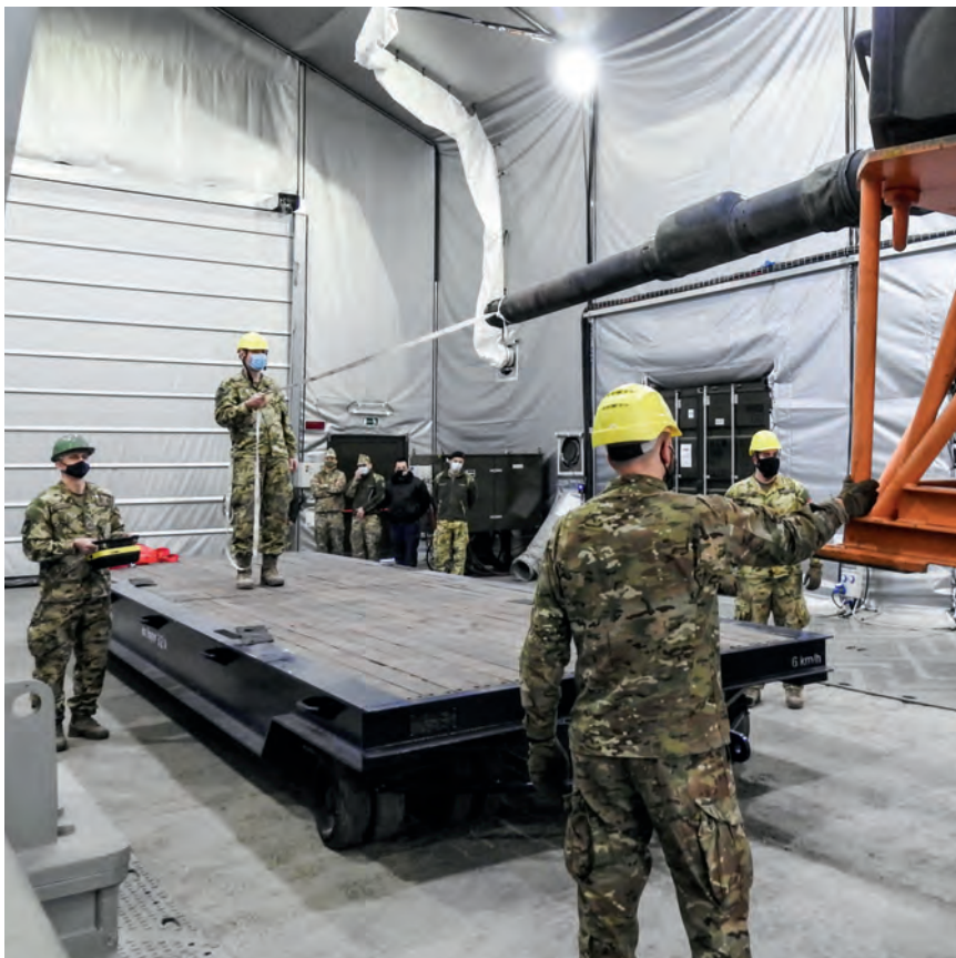
Leopard harckocsitorony érkezése ez év februárjában

Szalai Ferenc törzsásztiszt