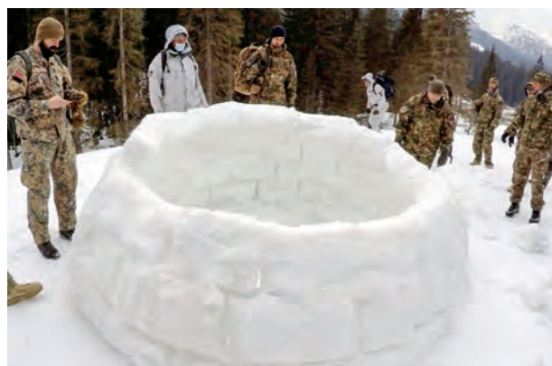
Készül a bivak