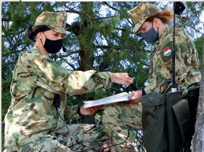
„Büszke vagyok Önökre!” 8. oldal