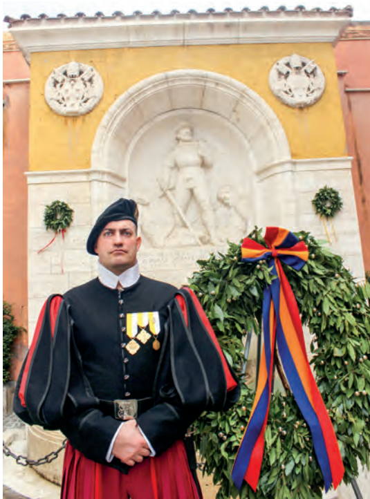
A főtörzsőrmester büszkén viseli a kitüntéseit

– Talán azt, amikor 2015 és 2019 között az új gárdisták gyakorlati oktatója voltam. Magától értendő volt, hogy a pápa szolgálatában álló fiatal állomány képességeinek és tudásának megalapozása számomra nagy kihívás és felelősség, amit nem vettem félvállról. Ez idő alatt azon dolgoztam, hogy továbbfejlesszem az alapképzést, hogy megfeleljen a ma felmerülő globális fenyegetések követelményeinek. Az új gárdisták képességeinek fejlődése és magabiztosságának erősödése nagy megerősítést adott számomra. Különleges élmény volt a kiképzés befejeztével „átadnom őket” leendő szolgálati helyükre. Nagyon büszke vagyok valamennyi gárdistára, akiket kiképeztem, különösen azokra, akik közül néhányan úgy döntöttek, hogy maradnak, és karrierjüket