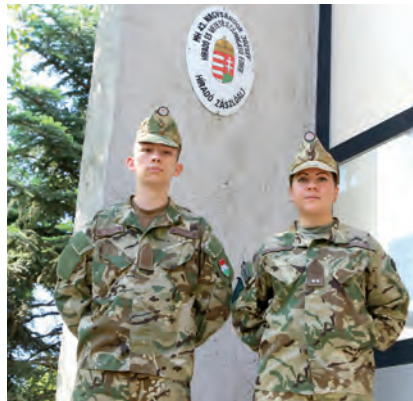
A két fiatal altisztjelölt kiemelkedően szerepelt az alakulatnál szervezett altiszti tanfolyamon

chárdnak ahhoz, hogy magára öltse a mundért. Családjának több tagja – édesanyja, édesapja és két nagybátyja – is katona. Nem esett hát neheze a beöltözés. Amikor bejött a járványhelyzet, a katonaságot látta legbiztosabb hivatásnak. Akkor fogalmazódott meg benne, hogy a civil programozás helyett hazáját szolgálva végzi ugyanezt.