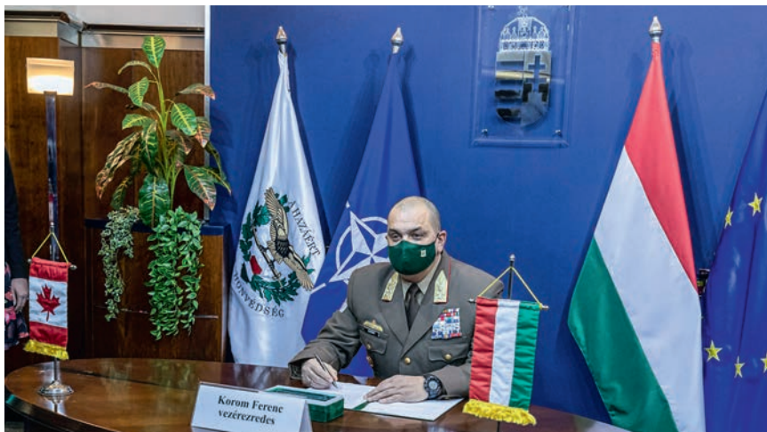
Korom Ferenc vezérezredes: Az eltelt több mint két év a Magyar Honvédség vezetése és a teljes személyi állománya számára is jelentős változásokat hozott

– Az eltelt több mint két év nemcsak számomra, de a Magyar Honvédség vezetése és a teljes személyi állománya számára is jelentős változásokat hozott. Olyan feladatok és kihívások határozták és határozzák meg szolgálatteljesítésünk minden napjait, amelyeket korábban nem tapasztaltunk. Gondolok itt a Magyarország Kormánya által meghatározott Zrínyi Honvédelmi és Haderőfejlesztési Program feladatainak teljesítésére, a szövetségi rendszerünkben adódó, határainkon kívüli fegyveres és nem fegyveres szolgálatok ellátására, a tömeges migráció kezeléséből adódó feladatainkra, valamint a COVID-19 elleni küzdelemben a Magyar Honvédség szerepvállalására. A Magyar Honvédség parancsnokaként büszke vagyok a haderő által az elmúlt időszakban végrehajtott példás helytállásra, valamint katonáinkra, akik esküjükhöz híven, számos esetben a családjuk-