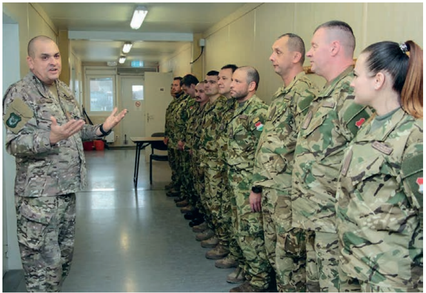
Az altisztek meghatározó résztvevői a feladat-végrehajtás közvetlen irányításának

– Az altiszti kar jelentős átalakuláson ment át a rendszerváltoztatás óta. A megváltozott biztonsági környezet, a Magyar Honvédséggel szemben korábban nem tapasztalt új típusú kihívások, a szövetségi tagságunkból következő elvárások, a haderőfejlesztési program kapcsán felmerülő igények egyértelműen megkövetelték, hogy áttekéljük az altisztek helyét és szerepét a honvédségben. Az alapvetően végrehajtói feladatkörökből az altisztek a vezetés-irányítás, valamint a döntéshozatali rendszer elengedhetetlen részévé váltak. Az altisztek az alárendelt állományra közvetlen ráhatással bíró állománykategóriaként kulcsfontosságúak a parancsnokok szándékának a végrehajtók számára is egységesen értelmezhető, végrehajtható leképezéséhez. Meghatározó résztvevői a feladat-végrehajtás közvetlen irányításának, tapasztalatukkal biztosítják az adott szintű parancsnok támogatását, ezzel a művelet sikerét. Kiemelt felelősséget viselnek a szervezet belső kommunikációjáért és aktív ráhatással vannak a szervezet belső folyamataira. A kölcsönös bizalom révén a parancsnok részére folyamatosan értékelést és visszajelzést adnak a küldetésről és az azt befolyásoló változások hatásairól. Ezek a feladatok – helyesen értelmezve és végrehajtva – nagyban hozzájárulnak a szervezet hatékonyságához, a változások megfelelő kezeléséhez. Határozott véleményem, hogy a Magyar Honvédség jövőbeni sikerének egyik alapvető kulcsa a jól felkészült, lojális, hazája iránt elkötelezett honvéd altiszti kar!