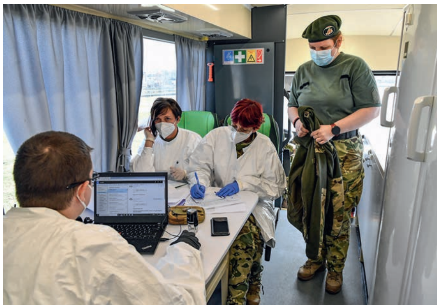
Munkavégzés az oltóbusz „fedélzetén”

– Vezérezredes Úr, az altiszti kar nevében köszönöm az interjút, az iránymutatást, az értékes gondolatokat.