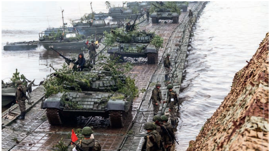
Fegyvernem és szakcsapat együttműködése

8. A támadásban haladj a lehető leggyorsabban. Alacsony sebesség-