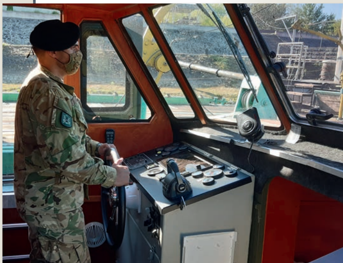
Az újhullámos 14. oldal