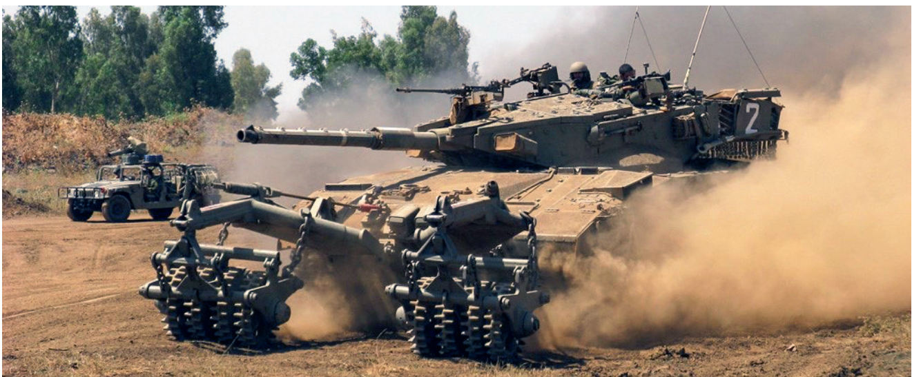
Aknaposóval felszerelt harckocsi