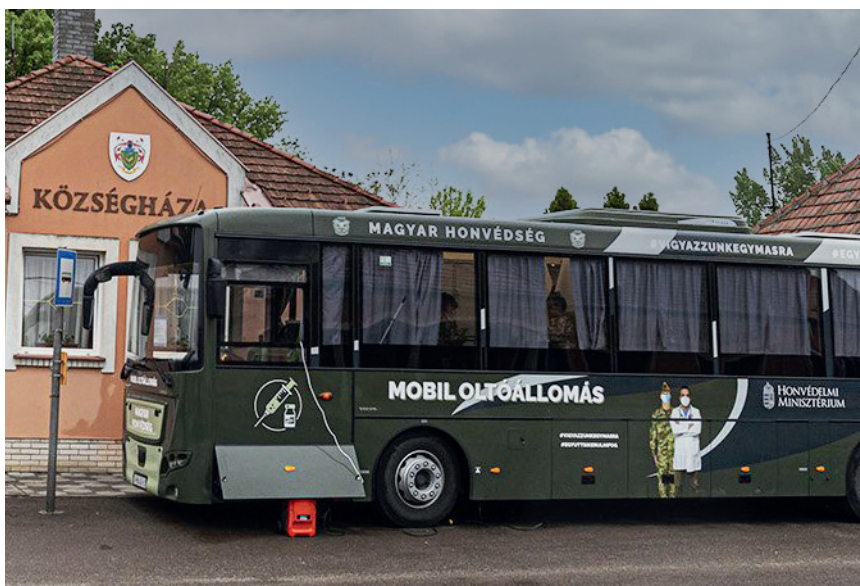
Az ország legkisebb falvaiban is megtapasztalhatták az emberek, hogy mindig számíthatnak a Magyar Honvédségre. Az oltóbusz Sajószentpéteren

– Fontosnak tartom, hogy a honvéd altisztek felkészítési rendszere biztosítsa az önbizalom, a kritikus gondolkodás, az önálló döntéshozatal képességének, valamint a végrehajtáshoz biztosított új fegyverekbe, fegyverrendszerekbe vetett bizalom kialakulását az állománycsoportban. Tapasztalhatjuk, hogy a fokozott tempójú technikai fejlődésnek köszönhetően egyre nagyobb erő, akár halálos tüzérek kerül egyre alacsonyabb döntési szint parancsnoksága alá, ami akár műveleteket is képes befolyásolni. Ezeknek az erőknek és eszközöknek az alkalmazása feltételezi a