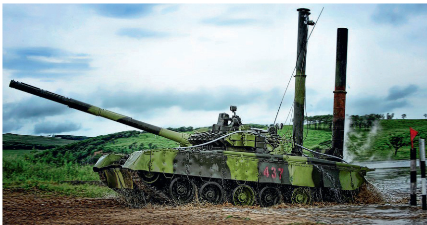
A folyó sem akadály

A második világháború harcai újra megmutatták, hogy nem a tankok típusa vagy száma, hanem a harcokszó katonák harci szelleme és