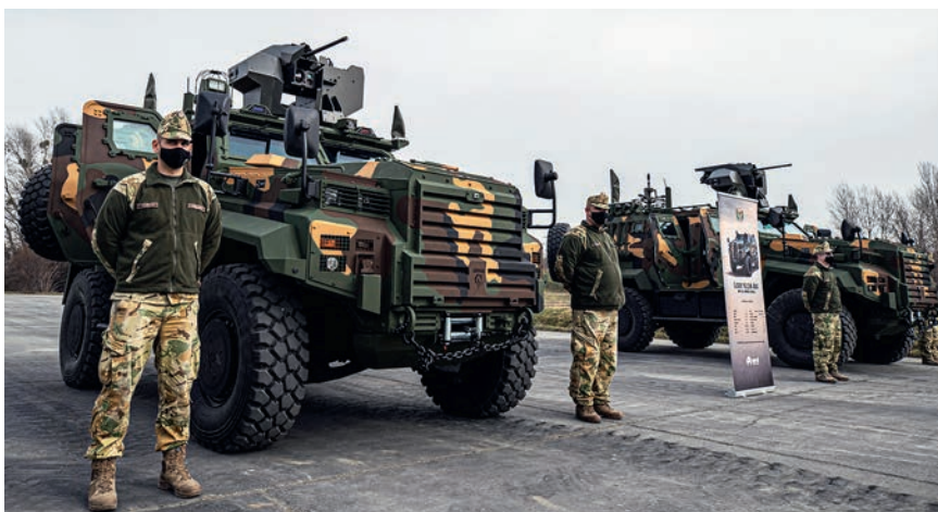
A Magyar Honvédségben soha nem tapasztalt technikai, technológiai, vezetés-irányítási fejlődés, megújulás zajlik

– A Zrínyi Honvédelmi és Haderőfejlesztési Programnak köszönhető megújulás nemcsak a technikai eszközök fejlesztését jelenti, hanem szemléletében, felfogásában és reményeim szerint hitében is egy új haderő jön létre. Olyan technikai, technológiai, vezetés-irányítási fejlődésnek vagyunk és leszünk tanúi, amely még soha nem volt tapasztalható a Magyar Honvédségben. Ez a folyamat kiemelt felelősséget ró a Magyar Honvédség vezetésére, de bátran állíthatom, hogy felelősséget ró minden katonára, rendfokozattól, beosztástól függetlenül, és minden honvédelmi alkalmazottra egyaránt. A megújulás folyamata azonban sohasem egyszerű! Véleményem szerint egy haderőben technikát, technológiát, adott esetben harceljárásrendet váltani a könnyebb feladat, sokkal nagyobb kihívás a mentalitás megváltoztatása. Ahogy mondani szoktam: keleti gondolkodásmóddal nyugati technikát üzemeltetni nem lehet. Nyilván fel kell hogy nőjünk ehhez a feladathoz. Komoly kihívást