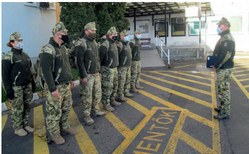
Indul a nap. Reggeli eligazítás a kórház udvarán

A magyar katonák – esküjükhöz híven – a végsőkig helytállnak a hazának és állampolgárainak a védelmében.