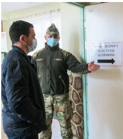
Az oltópontokkal kapcsolatos feladatok koordinálása is törzsőrmester feladatai közé tartozik

Családommal Szentesen élek, van két iskoláskorú gyermekem. 1999-ben, a sorkatonai szolgálat alatt kerültem kapcsolatba a katonaélettel. Kalocsa és Szentes helyőrségekben teljesítettem szolgálatot. A seregbe történő jelentkezéshez a döntő motivációt az ejtőernyőzés jelentette, amit már közel két éve űztem a kiskunfélegyházi Ejtőernyős Egyesületnél. 2003 őszén jelentkeztem a szegedi toborzóirodában, majd az orvosi szűrővizsgálatot követően 2004 tavaszán kerültem be a Magyar Honvédség állományába. Első beosztásomban a Magyar Honvédség 34. Bercsényi László Mélységi Felderítő Zászlóaljnál (később Különleges Műveleti Zászlóalj) ejtő-