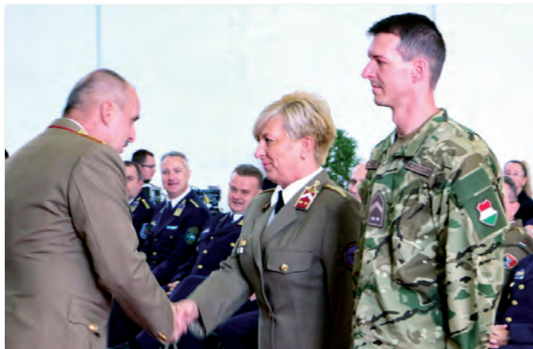
Eddigi pályája során több alkalommal is elismerték a munkáját

a szükséges logisztikai ellátást, mely magában foglalja a napi működéshez szükséges szakanyagok, szolgáltatások biztosítását. Az MH BHD ellátási tevékenységét a központi ellátó szervezetek által biztosított szakanyagok, valamint a saját hatáskörben kezdeményezett vagy végrehajtott beszerzési eljárások alapján végzi. A dandár fő feladatai: általános támogatás, erők és eszközök átcsoportosítása, haditechnikai, hadtáp- és közlekedési biztosítás, elhelyezési feladatok ellátása, készletek megalakítása, logisztikai gazdálkodás és együttműködés.