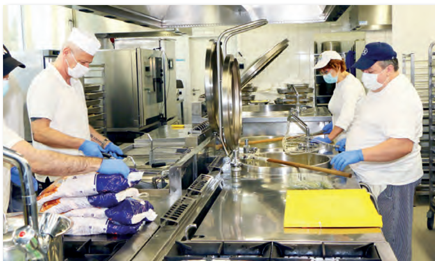
Több mint 400 személynek főznek ízletes és egészséges ételeket

SZUVIDÁLÁS A sous vide (ejtsd: szuvid) francia kifejezés, ami annyit tesz, hogy vákuum alatt. Az eljárást az 1970-es évek közepén Georges Pralus fejlesztette ki (Franciaországban, Roanne-ban, a nemzetközileg is elismert három Michelin-csillagos Troisgros étteremben) először azzal a céllal, hogy minimálisra csökkentse a drága libamáj elkészítésénél bekövetkező sütési súlyvesztést, ugyanakkor a legoptimálisabb ízt érje el.