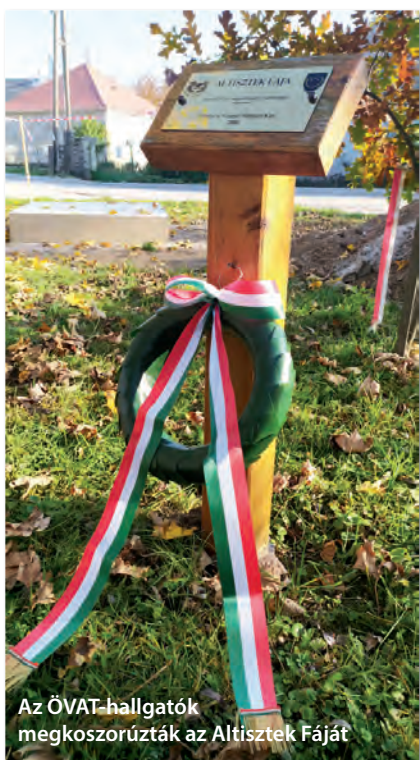
Az ÖVAT-hallgatók megkoszorúzták az Altisztek Fáját