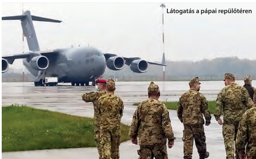
Látogatás a pápai repülőtéren