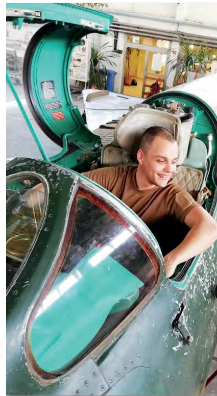
A pilótaülésben – egyelőre a hangárban

– Ami szerintem a legfontosabb: tudom, hogy sok elméleti anyag elsajátításával jár a képzés, ami itt-ott egy picit száraz, mindemellett sok és néha nehezen emészthető, de ne adják fel, hiszen megéri, ha valóban ezen a pályán akarnak elindulni. Mindig figyeljenek oda az oktatókra és a műszaki „öreg rókákra”, fogadják meg a tanácsaikat és kezeljék jól a tőlük kapott kritikát. Ezekből a későbbiekben nagyon sokat tudnak majd profitálni.