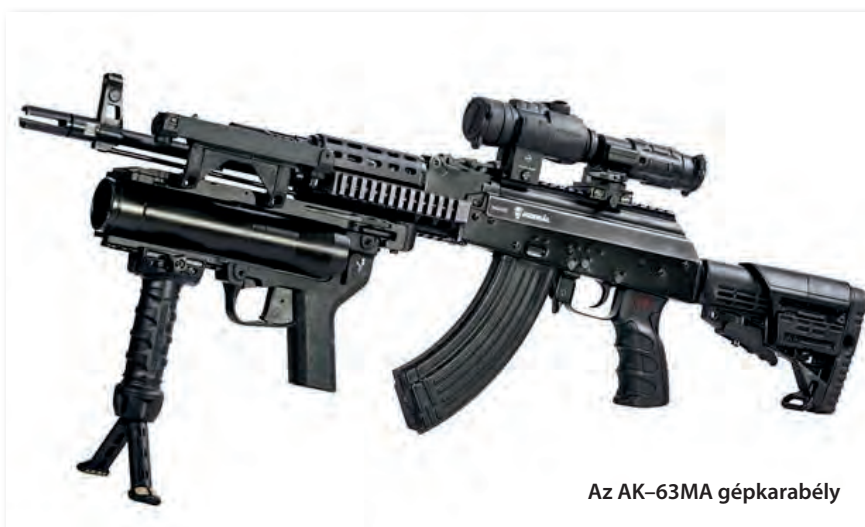
Az AK-63MA gépkarabély

csökkentése, a gyártás egyszerűbbé, gyorsabbá tétele, a gyártási költségek csökkentése volt. A 14 hónapos tervezési és kísérleti munka eredményeként elkészültek a szintén 7,62×39 mm-es töltényt tüzelő AK-63F, AK-63D, valamint AKM-63 jelű gépkarabélyok, melyek technikai paraméterei nagyrészt megegyeztek az elődmodellével, de a modernizált gyártástechnológia és a lényegesen kisebb anyagfelhasználás miatt előállításuk gyorsabb, gazdaságosabb volt. Az új gépkarabélyok tokja sajtolt acéllemezből készült, ezzel a fegyver tömege csökkent: míg az AK-47 tömege 4,3 kg, az AK-63F-é 3,93 kg, az AK-63D-é pedig 3,25 kg lett. Az AKM-63 esetében a fegyver előágán is pisztolymarkolatot helyeztek el, majd a faszerezvényeket teljes egészében műanyaggal helyettesítették, így a fegyver tömege tovább csökkent.