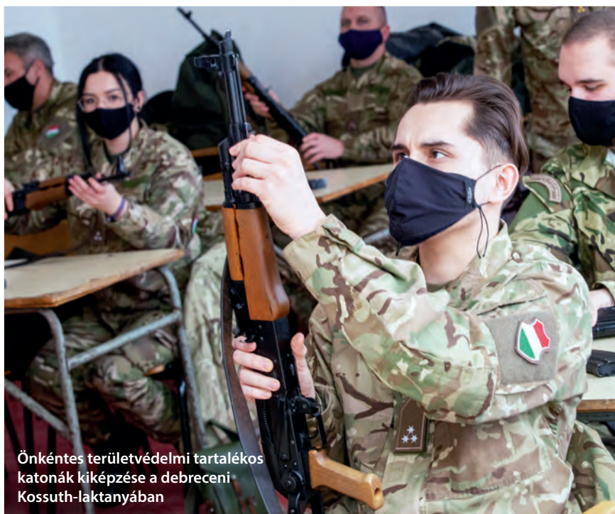
Önkéntes területvédelmi tartalékos katonák kiképzése a debreceni Kossuth-laktanyában

A keleti tömb országainak hadseregeiben, így a Magyar Néphadseregben is a 7,62×39 mm-es, magyar elnevezése szerint 43 mintájú lőszeret rendszeresítették. A nagy múltú, 1891. február 24-én alapított Fegyver- és Gépgyár Rt. (FÉG) üzemében – mely akkoriban épp Lámpagyár (Lampart) néven végezte tevékenységét – 1959 decemberében készült el az első sorozat AK 47-es gépkarabély, mely azóta is a legismertebb, és változataival együtt a legnagyobb példányszámban gyártott kézfegyver a világon, mely ezt a lőszerfajtát tüzezi. Az eredeti, orosz fegyvertől apró részleteiben eltérő magyar karabély az AK-55 nevet kapta. 1960