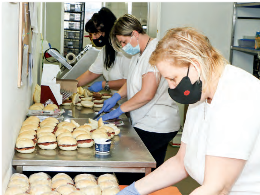
Készülnek a szendvicsek

Emellett a másfél méter távolság is kőbe van vésve. Lenti főtörzsőrmester örömmel újságolja, hogy eddig teljesen elkerülte a konyha állományát a fertőzés.