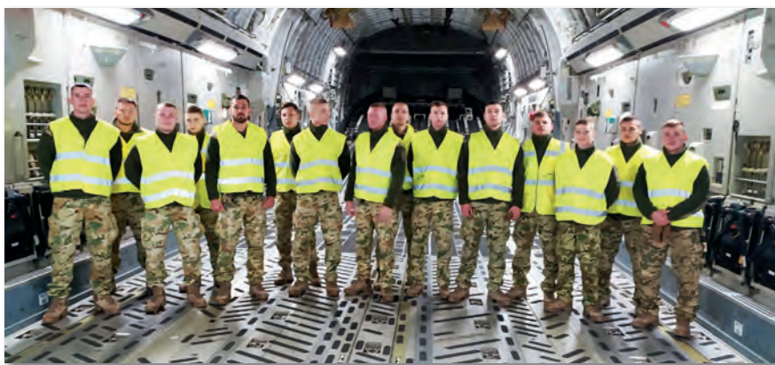
A képzés résztvevői csapatgyakorlaton

Másnap megkezdődött az öt hónapos kemény munka. Az MH Altiszti Akadémia Repülő Altiszti Oktatási Osztály, valamint az MH 86. Szolnok Repülő Bázis Repülő-műszaki Zászlóalj és a Repülő-műszaki Oktatásbiztosító Központ állományának köszönhetően elsajátították a repüléselméleti, avionikai (repülés-elektronikai) és sárkány-hajtómű berendezésekkel kapcsolatos ismereteket, gyakorlati munkafolyamatokat. Megtapasztalták a repülő-műszaki élet rejtelmait, szépségeit és