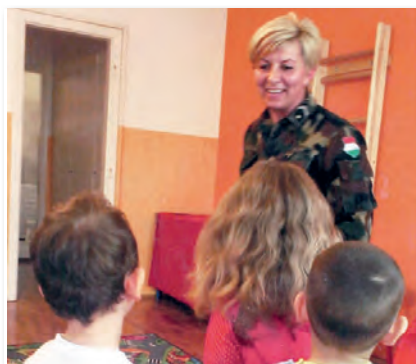
Óvodásoknak is mesélt már a katonaelet szépségeiről

Minden szakágnak saját nyilvántartója van, aki az anyagok mozgását az aLOGIR program alkalmazásával rögzíti, ezáltal válik az követhetővé és