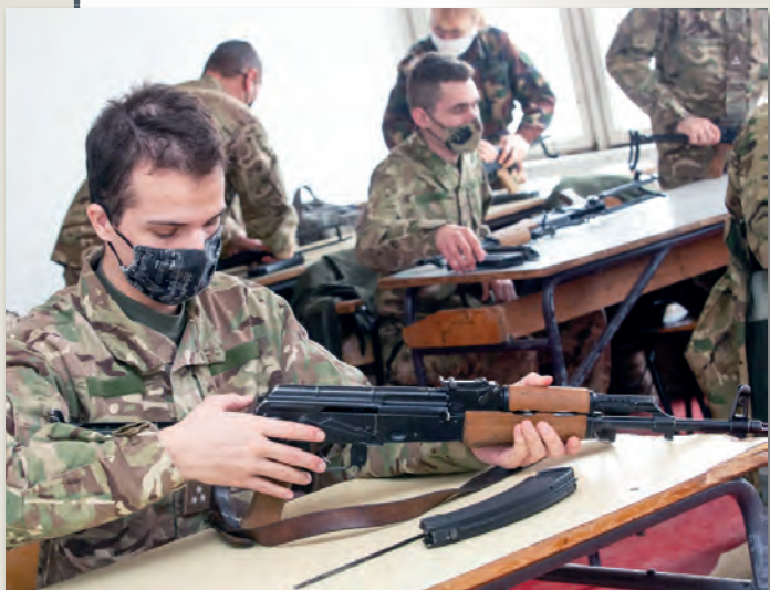
Ismerkedés az AK-63D gépkarabéllyal 6. oldal