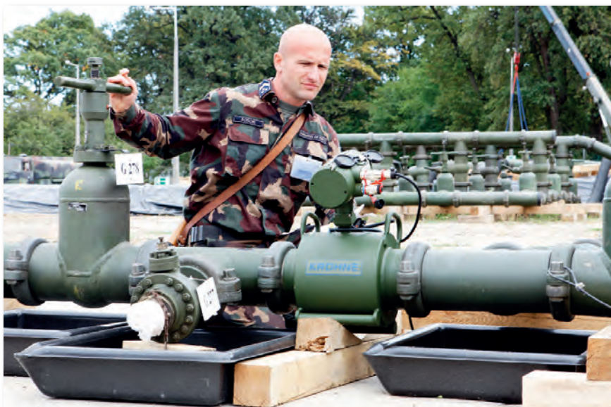
A bonyolult technika kezelése nagy odafigyelést kíván