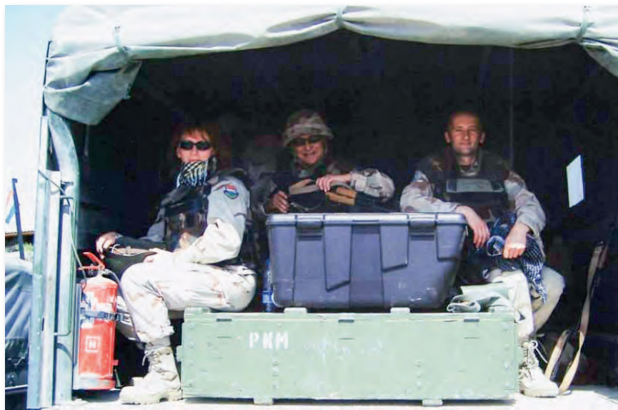
Az URAL platóján

Ezen időszak alatt még négy alkalommal adódott lehetőségem afganisztáni beosztásra pályázni, háromszor egyéves és egyszer féléves időtartamra: a Mazar-e Sharifban települt Nemzetközi Biztonsági Közreműködő Erő Északi Parancsnokság német tábori kórházának intenzív betegellátó osztályán szolgáltam intenzív szakápoló beosztásban. Itt is a szövetséges katonákat, rendőröket, kormányzati és nem kormányzati civil szervezetek képviselőit és helyi civileket láttunk el. Az intenzív ellátást igénylő kórképek felismerése, az életjelenségek és állapotváltozások megfigyelése, a speciális ápolási dokumentáció, a 24 órás intenzív észlelőlap idegen nyelvű vezetése, az intenzív ellátás során alkalmazott technikai berendezések kezelése, valamint az intenzív ellátásra szoruló betegek pszichés támogatása volt a feladatomban. Korábbi tapasztalataimat figyelembe véve, német egészségügyi szakszemélyzet hiányában, a Bundeswehr