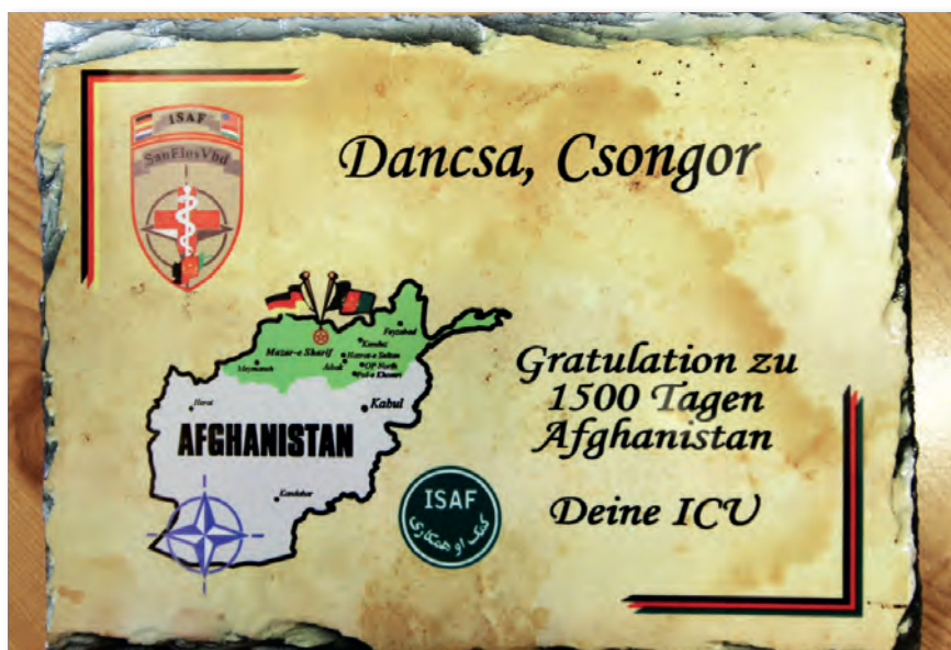
Ezeröttszáz nap Afganisztánban

A honvéd egészségügy racionalizálásával 2011-től a Magyar Honvédség Honvédkórház Tervezési és Szervezési Osztályán, majd a Magyar Honvédség Egészségügyi Központ Hadműveleti és Kiképzési Osztályán teljesítettem szolgálatot. Az előbbi beosztásban feladataim voltak: az egészségügyi ügyeleti és készenléti szolgálatokat teljesítő személyek jegyzéke és a szolgálatvezénylési parancsok egyezségének ellenőrzése; a kórház teljes személyi állományának név- és lakcímjegyzék-nyilvántartása és naprakészen tartása; a riasztási-értesítési terv kidolgozásában és az abban rögzített személyes adatok naprakészségének biztosításában való részvétel; valamint a kórházi