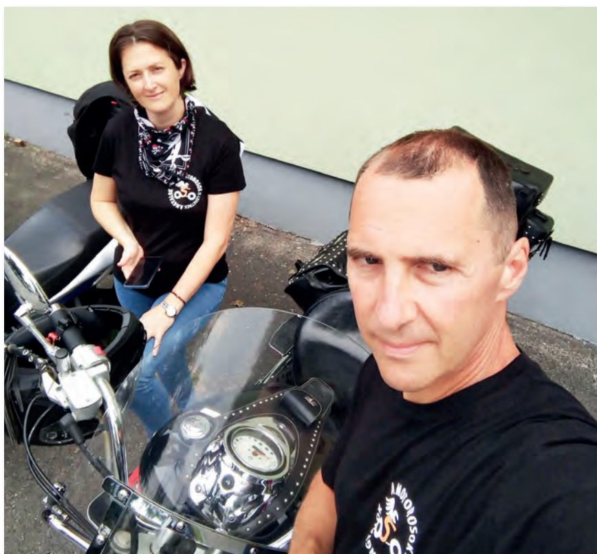
A hobbik sorában az első a motorozás

Az idei évben, 50 évesen arra adtam a fejem, hogy főiskolai képzésre jelentkezem. Felvételt nyertem a Nemzeti Közszolgálati Egyetem Államtudományi és Nemzetközi Tanulmányok Kar nemzetközi igazgatási szakára. Kettős cél lebeg a szemem előtt, az egyik a diploma megszerzése,