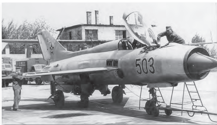
A vadászgépeket a műszaki század tiszthelyettesei készítették elő a repülésre