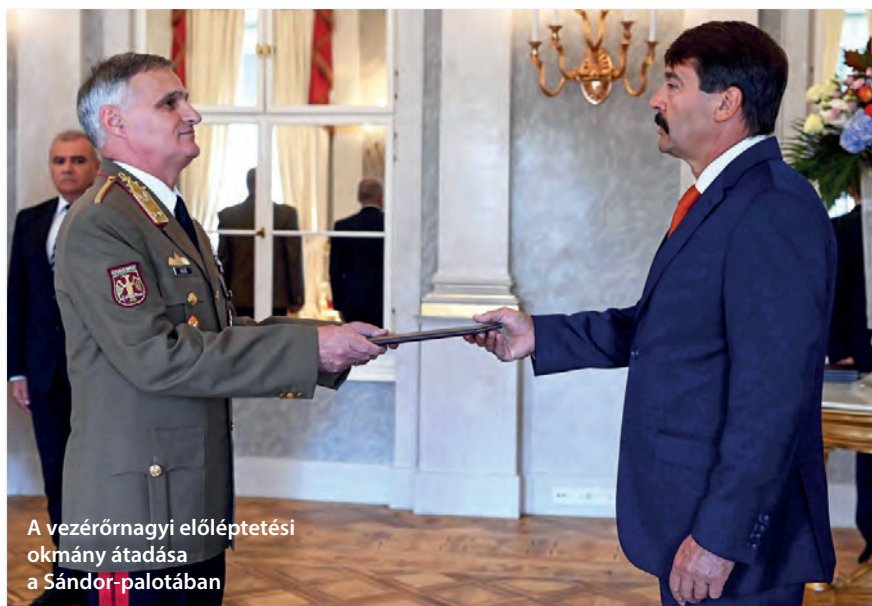
A vezérőrnagyi előléptetési okmány átadása a Sándor-palotában

Albert Einstein mondta: „Csak a hülyék tudnak mindent, a többiek életük végéig tanulnak!” Tábornok úr, Ön 1981-ben végzett mint gépesített lövész tiszttel, szakasparancsnoktól dandárparancsnokig minden parancsnoki beosztásban szolgált, a Honvéd Vezérkarnál csoportfőnökségeket vezetett, legutóbb az altisztképzésért felelős katonai szervezetet parancs-