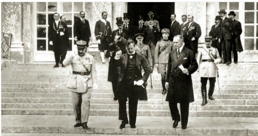
A szerződés aláírását követően a magyar küldöttség távozik a Nagy-Trianon palotából

Eközben Franciaországban a ceremónia kezdetét vette délután