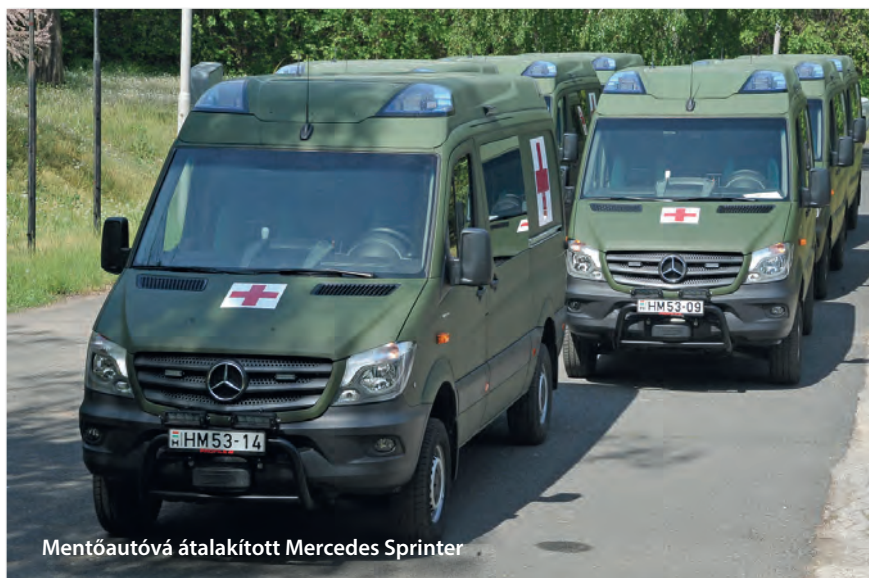
Mentőautóvá átalakított Mercedes Sprinter

A gépkarabély alkatrészeinek közel hatvan százaléka nagy szilárdságú polimer anyagból készül, ami jelentős súlycsökkenést eredményezett: a típus közel egy kilogrammal könnyebb az AK-63-nál. A NATO-ban alkalmazott sínrendszerre (Picatinny sín) különböző eszközöket – optikákat, hőkamerát, éjjellátó készüléket, lézeres cél-