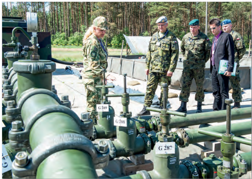
A német és a magyar szakemberek hosszú évek óta együttműködnek szakmai kérdésekben

A NATO idevonatkozó jelenlegi követelményeinek, előírásainak és