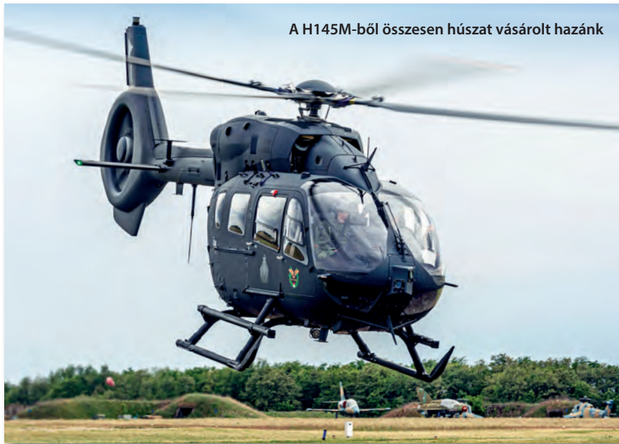
A H145M-ből összesen húszat vásárolt hazánk

A Honvédelmi és Haderőfejlesztési Program az elmúlt közel fél évszázad legkomplexebb, legátfogóbb fejlesztési terve, amelyhez a tárca rendelkezik a kormány anyagi és erkölcsi támogatásával. A 2017-ben megkezdett program elődleges célja egy korszerű eszközökkel felszerelt, a kor biztonsági kihívásaira megfelelő válaszokat adó haderő létrehozása. Az elmúlt évtizedekben nem volt példa hasonló, a honvédség minden területét érintő modernizációra. A folyamat eredményeként a Magyar Honvédség a térség meghatározó haderejévé válhat, tovább erősítve hazánk biztonságát, Európa közös védelmét és a NATO-t.