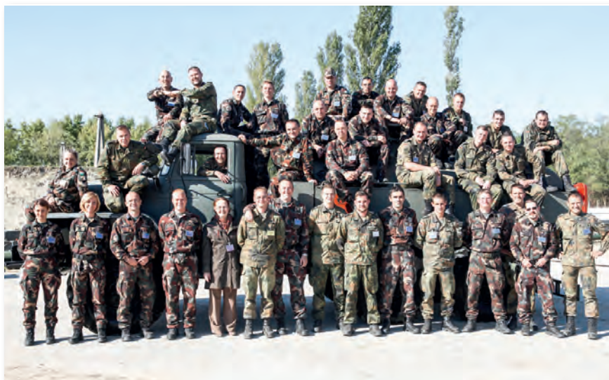
A két nemzet katonái a Safety Fuel 2012 gyakorlaton Hetényegyházán

A rendszer Németországból Magyarországra történő átcsoportosítása 2011-ben megtörtént a Magyar Honvédség Anyagellátó Raktárbázis (MH ARB) hetényegyházi bázisparancsnokságára. Az eszközök átvétele a honvédség régóta hiányzó képességeit pótolta, mivel viszonylag minimális ráfordítás mellett értékes logisztikai támogatással képes hozzájárulni a nemzetközi műveletekhez. Alkalmazásával gázolaj és repülőpetróleum tárolására és kiszolgálására alkalmas tábori üzemanyagraktárak létesíthetők, igény esetén pedig – megfelelő akkreditációs eljárással – a tábori raktárak magasabb nemzetközi