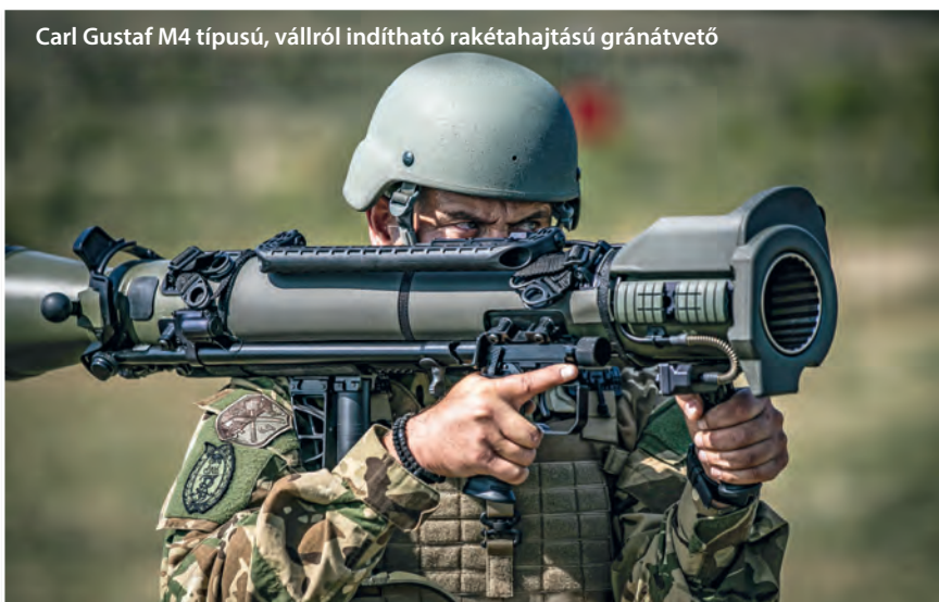
Carl Gustaf M4 típusú, vállról indítható rakétahajtású gránátvető

gükből adódóan – mind belső, mind külső függesztett teherként szállíthatók légi úton, s akár ejtőernyővel is kijuttathatók a műveleti területre. Ugyancsak 2019 novemberében adták át a honvédség részére a 100. Aries-buszt. Ezzel teljessé vált a honvédségi buszflotta, amely az eddigi tapasztalatok és visszajelzések alapján beváltotta a hozzá fűzött reményeket. Az ARIES projekt 2013-ban indult, ekkor kezdődött meg az Euro5-ös Volvo alvázra épített prototípus jármű gyártása Gödöllőn a HM Currus Zrt. telephelyén. A Magyar Honvédség igényeit figyelembe véve 2017-ben gyártották le az első, Euro6-os Volvo motorral szerelt ARIES moduláris autóbust. Az Aries buszok úgynevezett többfunkciós járművek, amelyek belső tere két és fél óra alatt átalakítható személyszállító, sebesültszállító vagy törzsbusz kivitelre is. Az eddigi tapasztalatok alapján a járművek menettulajdonságai kiválóak. A járműveket a legkorszerűbb aktív és passzív biztonsági berendezésekkel, valamint vezetéstámogató rendszerrel is felszerelték.