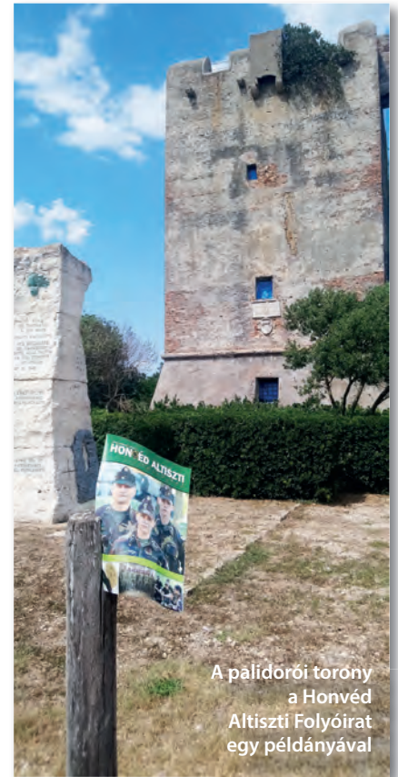
A palidorói torony a Honvéd Altiszti Folyóirat egy példányával

Írta és a képeket készítette: dr. Murinkó Attila ezredes