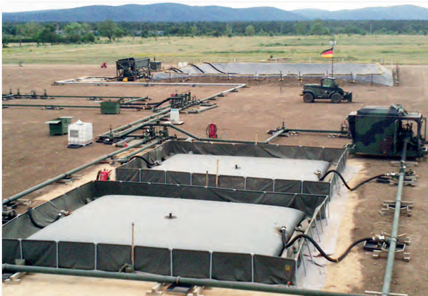
A tábori üzemanyagraktárak magasabb nemzetközi egységek üzemanyag-ellátását is biztosítani tudják

Ennek egyik lépéseként a német fél a NATO Üzemanyag Bizottságának bevonásával kétoldalú szakmai egyeztetéseket kezdeményezett Magyarországgal. Így született meg a Joint Logistics projekt, melynek főbb elemei a német-magyar állománnyal működtetett üzemanyagraktár – JET-A1 (repülőüzemanyag – kerozin) és ETG (finomított gázolaj) számára egyaránt – és ellátópont, egy ún. Bulk Fuel Installation (BFI), melynek kialakítását és működtetését a WARDAM-II készlet tette lehetővé.