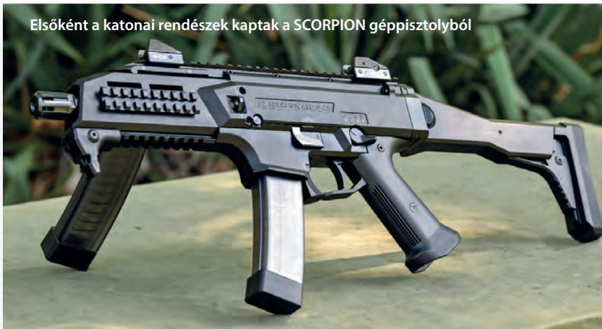
Elsőként a katonai rendészek kaptak a SCORPION géppisztolyból

megjelölőt, kiegészítő mellső markolatot és 40×46 milliméteres gránátvetőt – lehet rögzíteni, így a fegyver számos feladat végrehajtására optimalizálható. Váltámasza kihajtott állapotban (a katonák testfelépítéséhez igazítva) három hosszpozícióban rögzíthető, behajtva pedig például az ejtőernyős ugrások során is előnyös „viselet”. A kezelőszervei alpból kétoldaliak, míg egyes alkatrészei átszerelhetők a fegyver bal oldalára. A típus legnagyobb pozitívuma talán az, hogy a NATO-kompatibilitás követelményeinek megfelelő 5,56×45 milliméteres űrméretűről – pár csavar és alkatrész kicserélésével – nagyon gyorsan és egyszerűen átalakítható a jelenleg rendszeresített 7,62×39 milliméteres űrméretre.