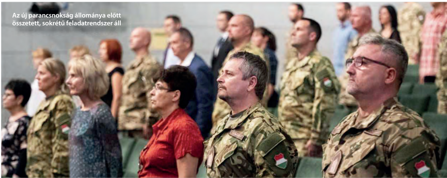
Az új parancsnokság állománya előtt összetett, sokrétű feladatrendszer áll