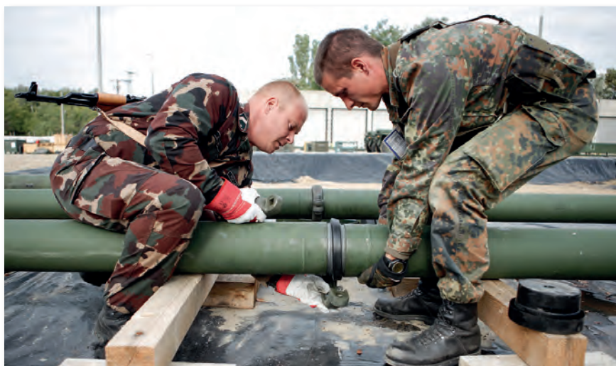
Magyar és német katonák közös feladat-végrehajtása

egységek üzemanyag-ellátását is biztosítani tudják. Ugyanakkor, a folyamatos hajtóanyag-ellátással természeti vagy ipari katasztrófák következményeinek felszámolását is képes támogatni; szükség esetén a MOL csővezetékeire is ráköthető.