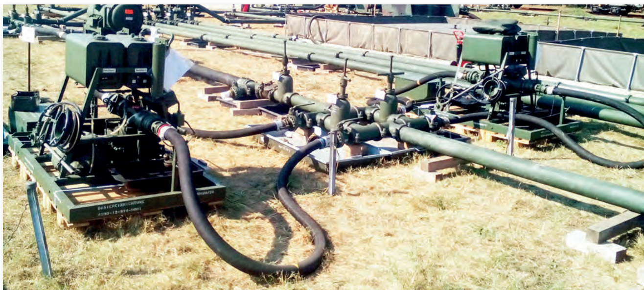
A telepített és feladatkész rendszer

A következő években folytatódtak a közös gyakorlatok: Capable Logistician 2015 (Magyarország, Bakony), Safety Fuel 2016 (Magyarország, Pápa), Safety Fuel 2017 (Németország, Hohn).