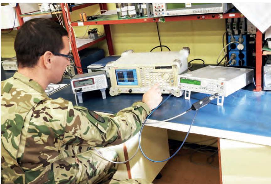
Műszeres kalibrálás a laboratóriumban

Metrológus szakembereink a folyamatos képzésekkel és új képességek megszerzésével készülnek a már említett feladatokra, így a korszerű mérőeszközök megjelenése a Magyar Honvédségben nem jelent akadályt.