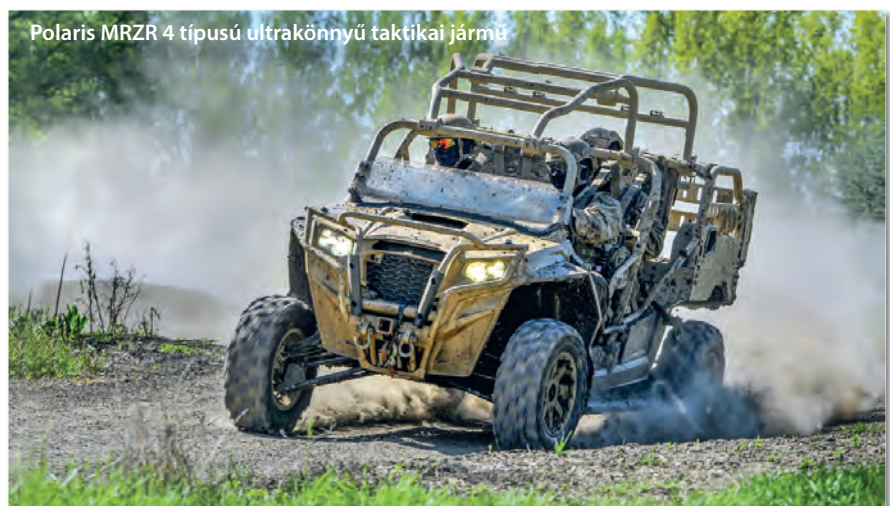
Polaris MRZR 4 típusú ultrakönnyű taktikai jármű

A Magyar Honvédség alakulatai 2018 tavaszától több lépcsőben új Rába teherautókkal és Suzuki Vitara gépjárművekkel gazdagodtak; ezek a beszerzések a hazai ipart, illetve hadiipart is erősítették, ami szintén az egyik kiemelt célja a modernizációs programnak. Ugyancsak ekkor vette használatba az MH 2. vitéz Bertalan Árpád Különleges Műveleti Dandár is az amerikai gyártmányú, Polaris MRZR 4 típusú ultrakönnyű taktikai járműveket, amelyek – méretükből és egy tonna alatti töme-