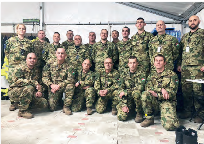
A Magyar Honvédség vezénylőszázadosa is meglátogatta a „csöveseket”

Handó István törzsszázados