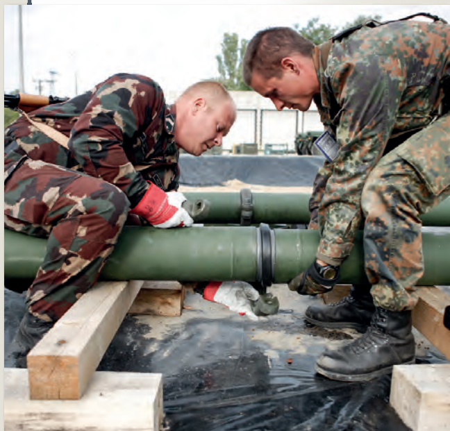
„Csövesek” Hetényegyházán 14. oldal