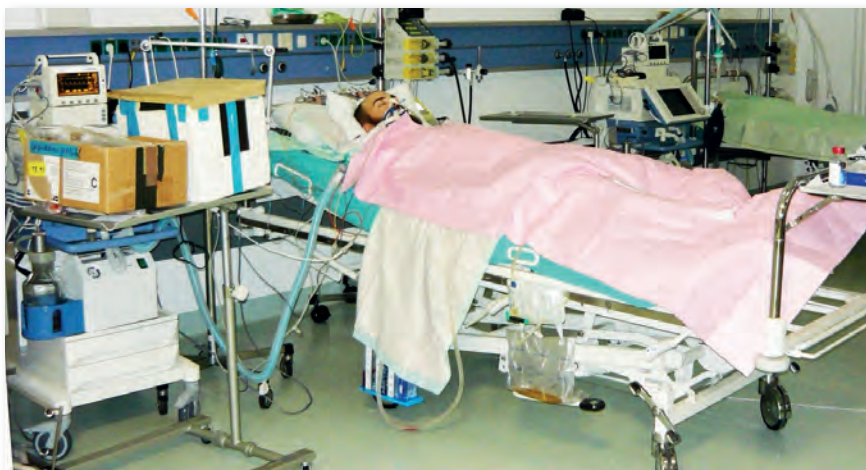
Az altiszti Afganisztánban a német tábori kórház intenzív osztályán szolgált

Mivel kötelékben még nem szolgáltam műveleti területen, így 2018. márciusban, a koszovói Novo Selóban települt MH KFOR Kontingens Hadműveleti és Képzési Részleg Harcvezető Központ beosztott zászlósi beosztására jelentkeztem, ahol 12 órás, váltásos ügyeleti rendben a folyó műveletek és események követése, a kontingens gépjárműveinek ki- és beléptetésének nyilvántartása, a