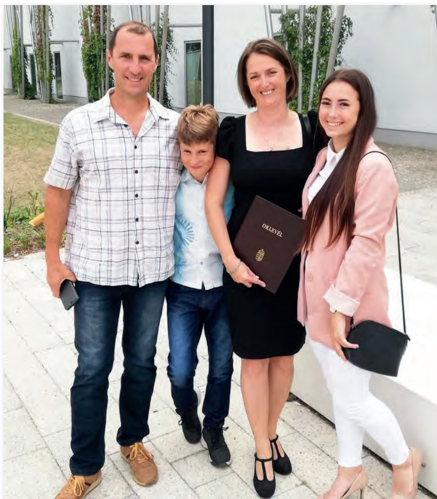
Zsolt számára fontos a hátszország, a család

Természetesen első a család, utána a motorozás, a horgászat, majd pedig az olvasás. Hála istennek, a feleségem nagyon megértő, ő is katona, a Magyar Honvédség Transzformációs Parancsnokságon szolgál személyügyi tisztként. Teljes mértékben elfogadja, hogy