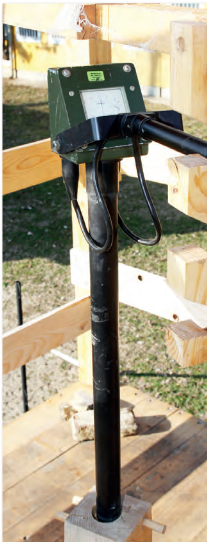
Fém- és aknakereső műszer

A modern haditechnikai eszközök üzemeltetésében a kalibrálási tevékenység még hangsúlyosabb szerepet kap. Az állomány feladatai közé tartozik a Gripen típusú vadászgépek mellett az Airbus A319-es és a Falcon 7X típusú szállító repülőgépek, valamint a H145M könnyű, többcélú helikopterek mérőeszközeinek rendszerbe illesztése is. Ez a későbbiekben ki-