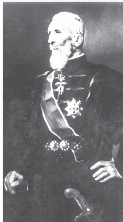
Gróf Apponyi Albert

A trianoni békeszerződés előkészítése 1919. január 18-án kezdődött a Párizs környéki kastélyokban, ahol habár a legyőzöttek képviselői is részt vettek a tárgyalásokon, de hatásuk nem volt az események menetére, ellenérveket nem sorolhattak fel, csak a kikényszerített szerződéseket írhatták alá. A trianoni béke pontjai ismertek, Magyarország elveszítette területének és lakosságának mintegy kétharmadát, ennek megfelelően a mintegy 320 ezer négyzetkilométer területű, húszmilliós középhatalomból 90 ezer négyzetkilométeres, hétmillió lakost számláló kisállammá vált. Lakosságának szembesülnie kellett a felfoghatatlan tényekkel, hiszen nemcsak területeket vettek el, de ennél sokkal több mindent, mint mondták akkor: „az alföldi magyarnak nincs annyi fája, hogy koporsót ácsoltathasson magának, amiben majd eltemetik. Száraz ke-