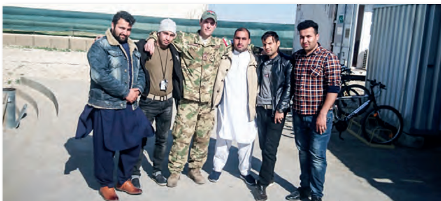
Az altiszt missziós szolgálatai alatt rengeteget tanult, tapasztalt, megismerte más nemzetek hadseregeit

velet Északi Kiképző, Tanácsadó és Segítő Parancsnokság (NATO Resolute Support Mission, Train, Advise and Assist Command – North, NATO RSM TAAC – North) vezénylőzászlósi tanácsadó beosztásában teljesítettem szolgálatot. A misszióim alatt rengeteg tanultam, tapasztaltam, jobban megismerhettem más nemzetek hadseregeit, betekintést nyerhettem a magasabb szintű törzsmunka rejtelmeibe.