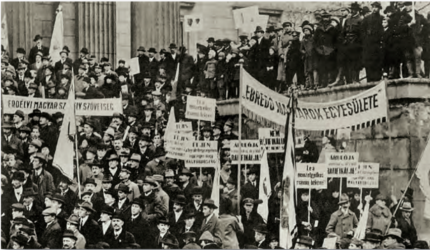
A békediktátum ellen országsszerte hatalmas tiltakozó megmozdulások szerveződtek

lesték és mintha legfőbb gondjuk az lett volna, hogy meglehetősen színházias elhelyezkedéssel statisztériát alkossanak (...). Magyarország sorsa, huszonnégymillió lakosát 325.000 négyszögkilométer területét, amelyet megfosztottak Szlovákiától, Horvátországtól és Erdélytől, sokkal kevésbé érdekli őket, mint a görög király sziluettje, amely a karzat egyik hatalmas ablakának keretében feltűnik. Hirtelen még nincsen egészen fél öt, egy térdnadrágos, ezüstláncos terembiztos jelenik meg: »Magyarország meghatalmazott miniszterei, a kiküldött magyar urak.« (...) A terem hamar kiürül. Elsőnek a magyar megbízottak távoznak