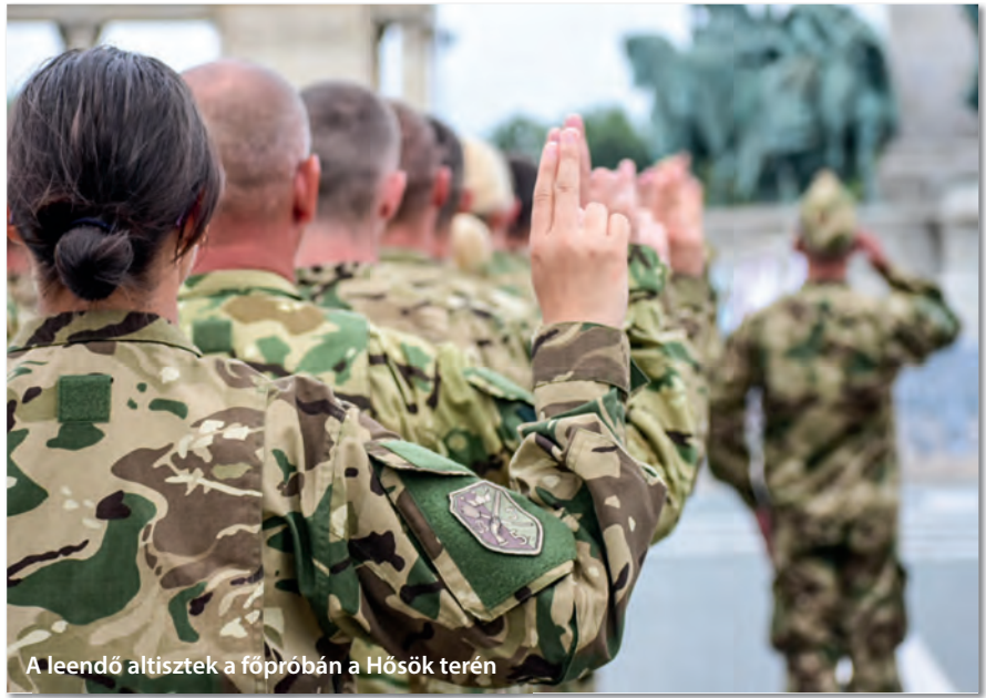
A leendő altisztek a főpróbán a Hősök terén

Nemcsak az avatottak létszáma miatt volt történelmi jelentőségű esemény a 2020. július 18-ai altisztavatás, hanem azért is, mert az iskolarendszerű képzésben végzők mellett ott álltak a Hősök terén az új típusú Acélkocka Altisztképzési Rendszerben (AAR) képzett leendő altisztek is. Az új rendszer célja, hogy magas színvonalú, gyakorlatcentrikus képzéssel készítse fel a jövő altiszteit feladataikra. Olyan altisztek kerülnek ki az új képzési rendszerből, akik képesek vezetni, döntéseket hozni, ezáltal ők képezik majd a megújuló Magyar Honvédség gerincét.