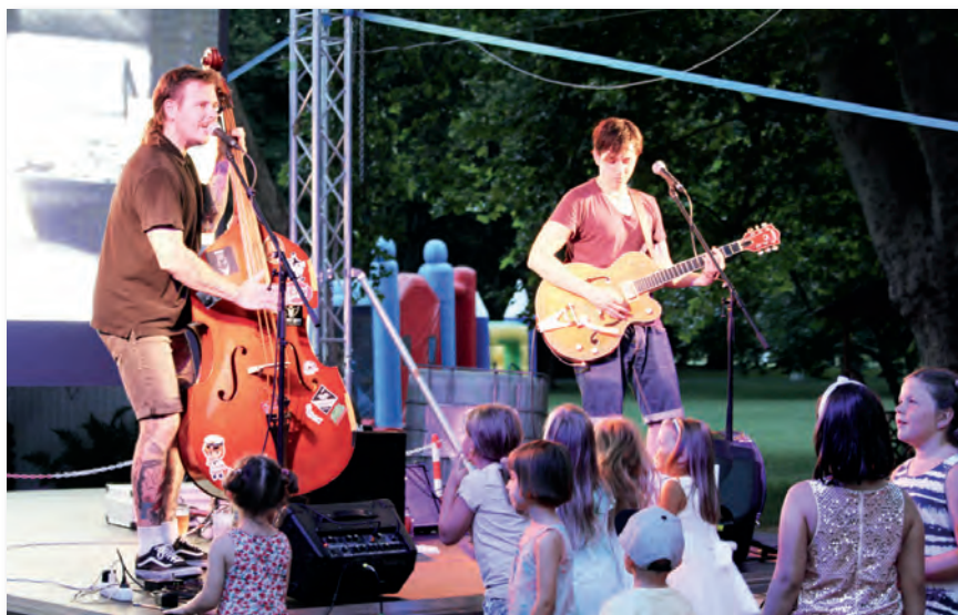
A rockabilly életézés a gyerekeket is átjárta

Az egész évben üzemelő pihenőhely, mind programjait illetően, mind a környezetét tekintve, időről-időre megújul. A különböző évszakoknak köszönhetően mindig más arcát ismerhetjük meg az üdülőt körülvevő tájnak, mely oly csodás, hogy bármely időszakban érkezünk ide, mindig felfedezhetünk valami újat. Megunhatalan és izgalmas. Éppúgy sugárzik belőle a nyugalom, mint a kaland. Ez nem is csoda, hiszen több mint 100 éves története van, ami oly sokszínű, hogy igényelte a könyv formában történő megjelenést is. A jellegzetes zsalugáteres ablakokkal díszített épületegyütteshez vezető, virágokkal és néhol platánokkal övezett sétányokon való séta felér egy időutazással. Az épületek fala-