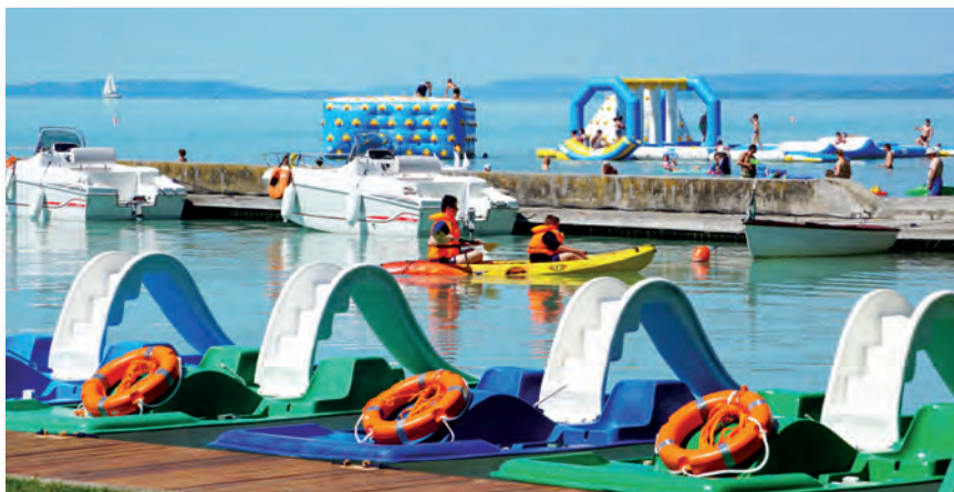
Víz és játék minden mennyiségben