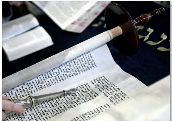
A megbocsátás új lehetőséget ad számunkra az új-rakezdésre