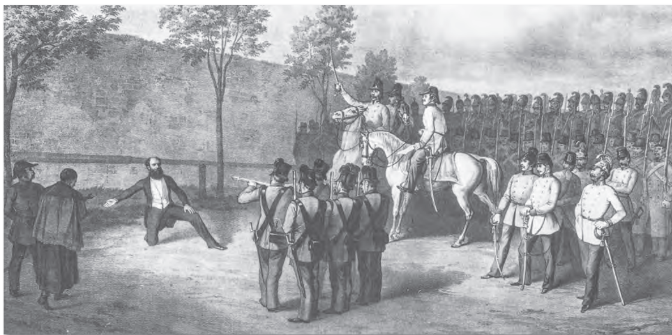
Batthyány Lajos kivégzése. Louis Noëlli litográfiája