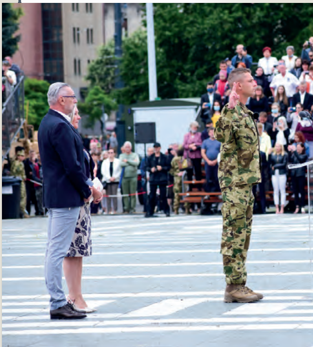
Őrmesternek lenni 8. oldal