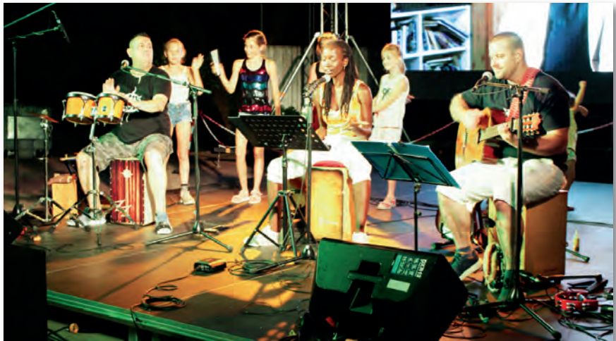
A Sunset Lux zenekar hangszereit a gyerekek is kipróbálhatták

Ősszel zenés estek, gyermekműsorok, megemlékezések és kiállítások színesítik a programot.