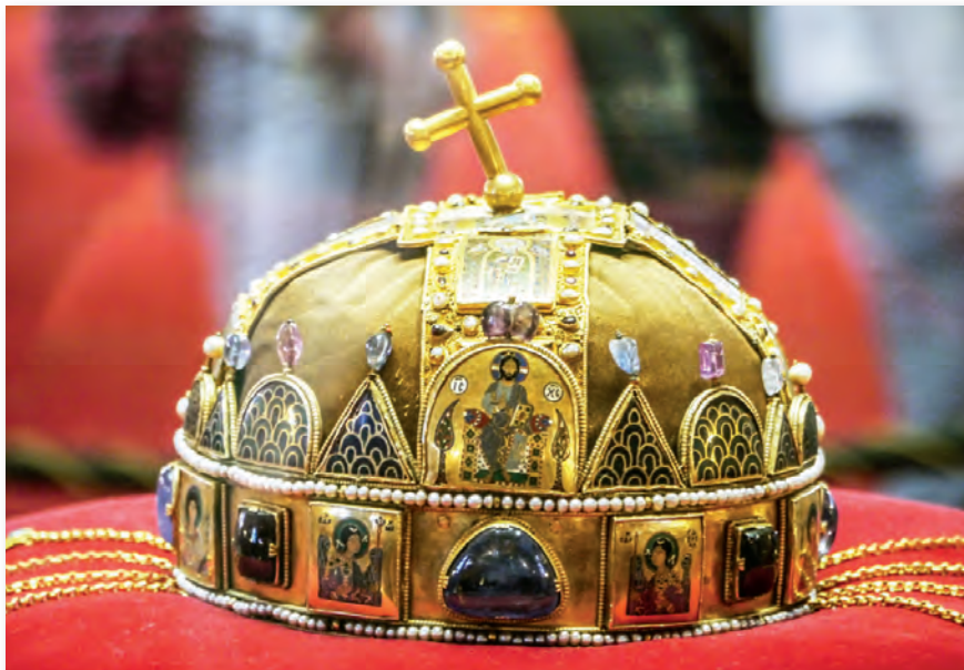
A Szent Korona