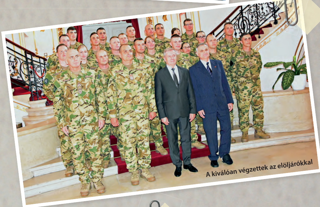
A kiválóan végeztek az előjárákkal