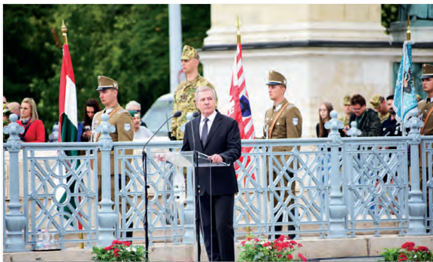
Dr. Benkő Tibor honvédelmi miniszter is szólt a most avatott ifjú altisztekhez

Az altisztavatáson Benkő Tibor honvédelmi miniszter köszöntőjében kiemelte: az altishti eskü magasztossága egy életre szól, melylyel a katonák elkötelezik magukat hazájuk, nemzetük mellett, ha kell az életük árán is. A tárcavezető rámutatott arra, hogy a Honvédelmi és Haderőfejlesztési Program keretében létrehozott „Acélkocka-rendszer” szerint képzett altisztek