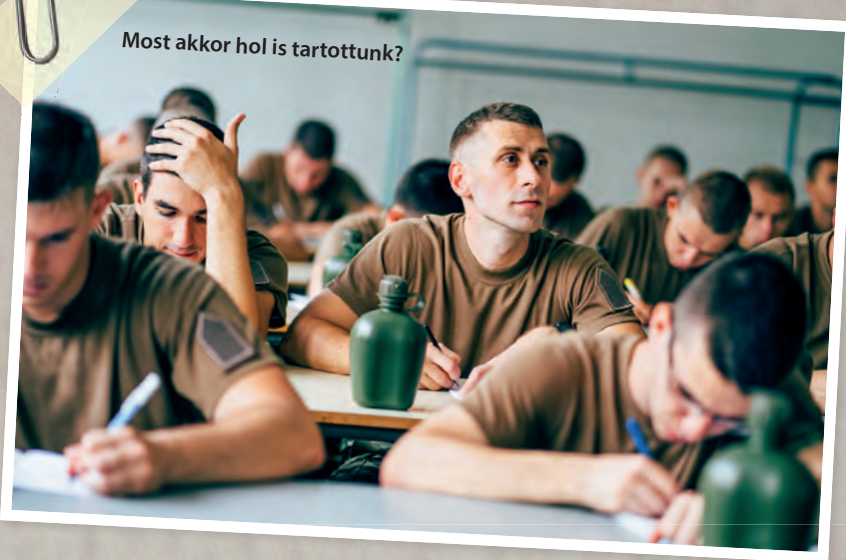
Most akkor hol is tartottunk?