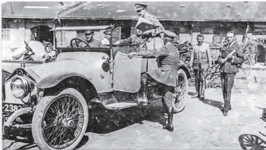
Antant ellenőrzőbizottsági tagok a Magyar Aeroforgalmi Rt. telephelyén, a budapesti Váci út 69. szám alatt

Az egyik példa a csapatok rendvédelmi szervek égisze alatt történt rejtésére az 1921. március 1-jén létrehozott ún. budapesti rendőr-