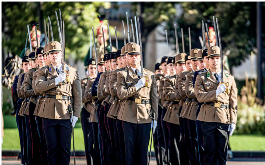
Tisztavatás a Parlament előtt

gyar uralkodóként. Ekkor még nem tartottak körmeneteket, erre a 19. század második évtizedének vége felé került sor.