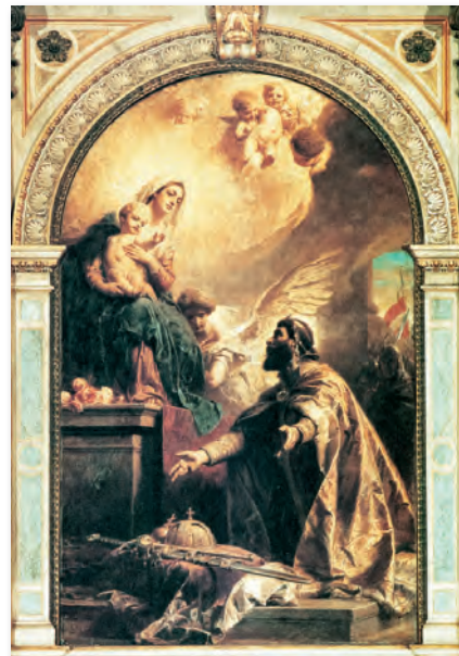
Benczúr Gyula oltárképe a Szent István-bazilikában

A ugusztus 20-a Magyarország nemzeti ünnepe és hivatalos állami ünnepe az államalapítás és az államalapító I. István király emlékére. Az ünnep kapcsán született írások, megemlékezések a keresztény hit elfogadásának jelentőségét, az európai népek családjába való beilleszkedést állítják a középpontba. Vitathatatlan, hogy augusztus 20. a magyarság legrégebbi és legnagyobb ünnepe, mégsem „kopik el”, fénye nem halványul, mert ilyenkor nemcsak egy történelmi eseményről, de magyar mivoltunkról is megemlékezünk. Minden diadalunkat és nemzeti tragédiánkat lajstromba vesszük; arról az útról emlékezünk meg ilyenkor, amely honfoglaló őseink megérkezésétől a jelen modern, gyarapodó Magyarorszáig vezetett.