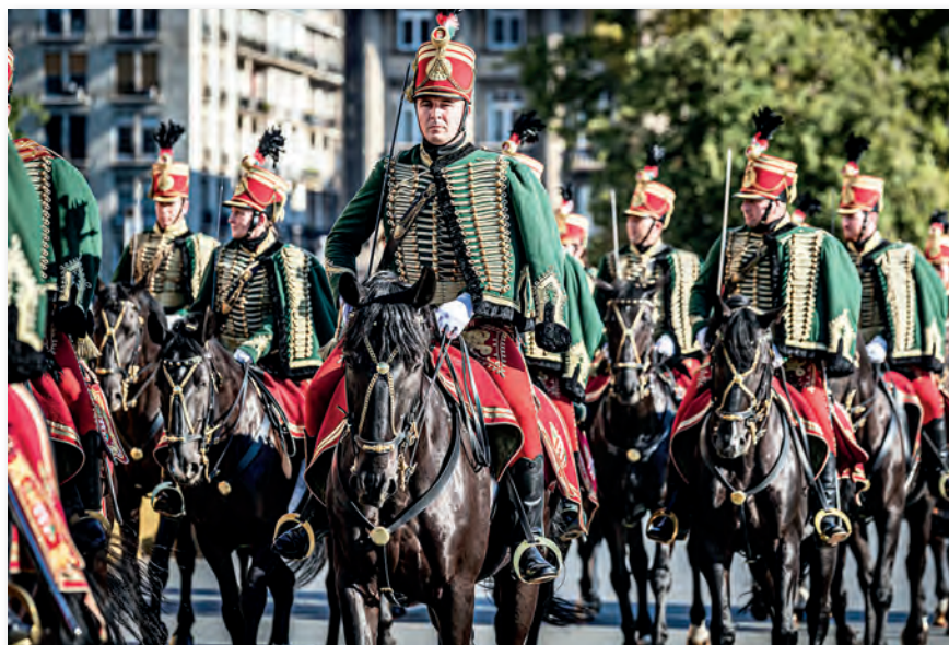
Hagyományőrző huszárok augusztus 20-án