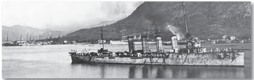
Az osztrák-magyar Haditengerészet NOVARA cirkálója a Cattarói-öbölben

A béke katonai előírásaival örökre a legyőzött helyzetét határozták meg az ország számára, hiszen biztosították a győztes antant hatalmak és a Monarchia romjain létrejött utódállamok (a későbbi kisantant országok) teljes katonai erőfölényét. A győztesek célja az volt, hogy Magyarország csupán egy a belső rend fenntartására és határrendőr-szolgálatra alkalmas, 35 000 fős haderővel rendelkezzen egy korszerű és az általános védkötelezettségen alapuló tömeghadsereg helyett, amely a Kárpát-medencei régió leggyengébb hadseregeként - alacsony létszáma és minimális fegyverzete következtében - támadó hadműveletek végrehajtására képtelen legyen. A győztesek elérték céljukat, hiszen a Nemzeti Hadsereg, majd a Magyar Királyi Honvédség még a természetes határaitól megfosztott ország hathatós védelmét sem volt képes ellátni, annak cselekvőképtelenség-