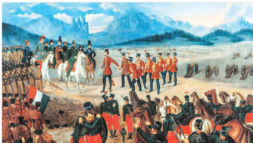
A világosi (szőlősi) fegyverletétel, 1849. augusztus 13. Szkcicsák-Klinovszky István olajfestménye

1999-ben a Magyar Posta az 1848-49. évi forradalom és szabadságharc 150. évfordulójára bélyegblokkot bocsátott ki, mely az aradi vértanúk arcképét is ábrázolja. Árusították 1999. március. 12. és 2000.