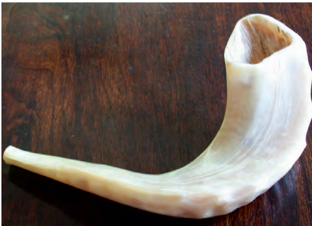
A sófár, a lélek hangja