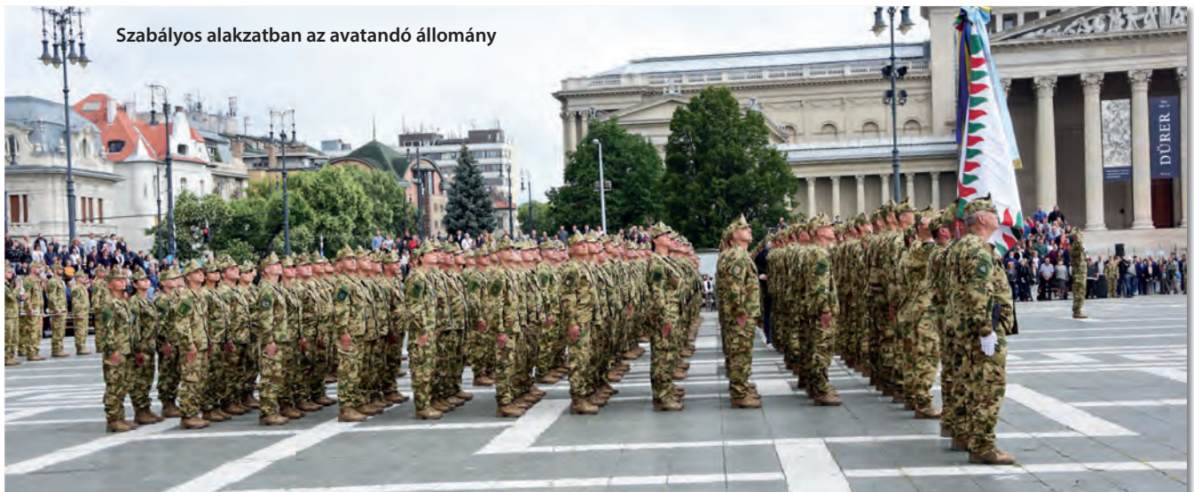
Szabályos alakzatban az avatandó állomány

a Magyar Honvédség elindította az AAR egyéves belső tanfolyamrendszerű pilot kurzusát, amelyre közel háromszázan jelentkeztek, hogy civil életüket hátrahagyva a katonai életpályát válasszák. Továbbá azok a már állományban lévő katonák is az AAR szerint jutottak el az ünnepélyes eskütételhez, akik előljáróik javaslata alapján kezdhették meg az altisztte válás folyamatát. Ebben