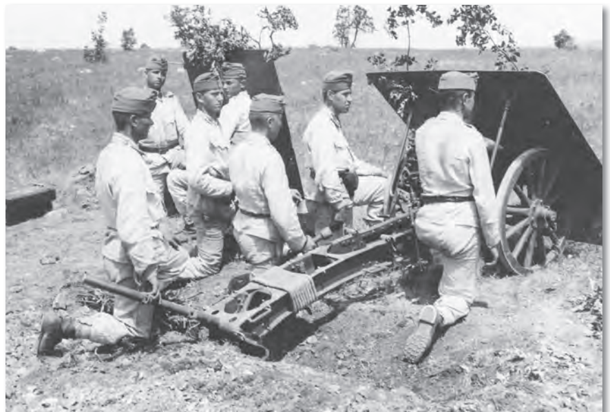
A hajmáskéri tüzérségi lövésziskolához tancsapatként beosztott 7. tüzérosztály 8 cm-es hegyiágyúja tüzékészültségben

A békediktátum 133-139. cikkében megfogalmazottak szerint a katonai határozatok végrehajtását a budapesti székhelyű Szövetségek Közi Katonai Ellenőrző Bizottság felügyelte, amelyben a négy főhatalom (Olaszország, Franciaország, az Egyesült Államok és Nagy-Britannia) képviselői kaptak helyet. A bizottságnak joga volt a békediktátum bármelyik pontjának végrehajtását az ország területén bárhol ellenőrizni. A bizottság fenntartásának teljes költségét az ország viselte (havonta 100 ezer koronával terhelte a kincstár kiadásait), a működési feltételeket, az