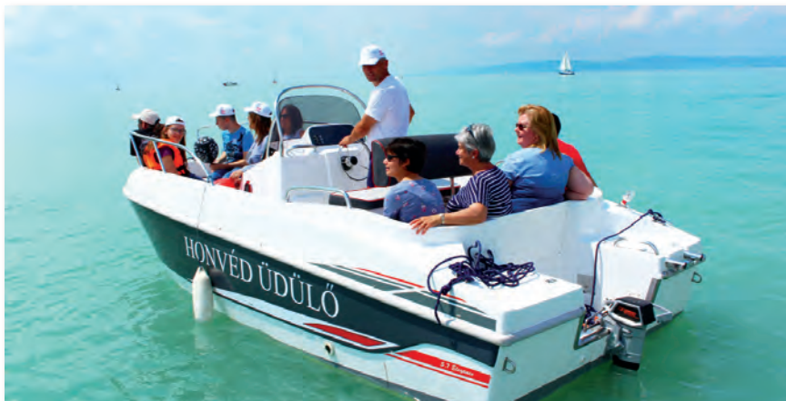
Minden jó, ha indul a hajó

évre bővül a minőségi szolgáltatások köre. Balaton-parti helyszín révén, az egészséges életmód szellemében szinte minden vízi, illetve szárazföldi sporttevékenység a vendégek rendelkezésére áll. A kültéri fitnesspark mellett futópálya, mobil kosárpálya, minigolf-, strandröplabda-, valamint teniszpálya és megannyi sportjáték várja az aktív kikapcsolódásra vágyókat. A parton megtalálható még napvitortlával ellátott játszótér, gyermekmedence, ugrálóvár-komplexum,