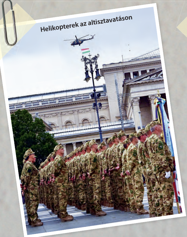
Helikopterek az altisztavatáson