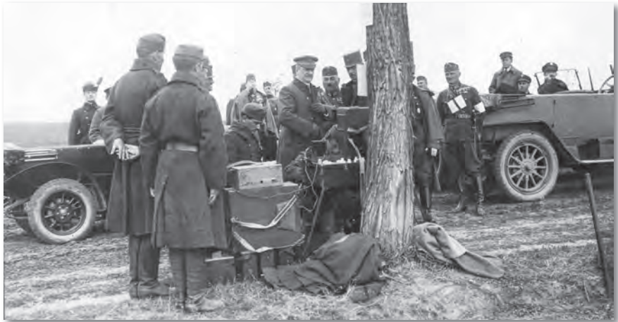
Horthy Miklós kormányzó megszemléli a gyakorlatot a piliscsabai kihelyezéskor, 1926

A Magyar Királyi Honvédséget 1922-től a honvédelmi miniszter, a Honvédség főparancsnoka és a Honvédelmi Minisztérium VI. Csoport főnöke (vezérkarfőnök) irányította. Annak hadrendjébe 7 vegyesdandár (42 gyalogzászlóalj), 4 huszárezred (16 század), 4 önálló tüzéruveg, 3 utászászlóalj, továbbá egy autó-géppuskás és egy autó-ágyús osztag tartozott. Azok állományát 1750 tiszt, 2334 altiszt, 30 916 fő legénység és 1300 polgári közigazgatási alkalmazott alkotta. Természetesen a katonai hatóságok (a kormányzó katonai irodája, a Ludovika Akadémia és a lőterek) szervezéséről, felállításáról is intézkedtek.