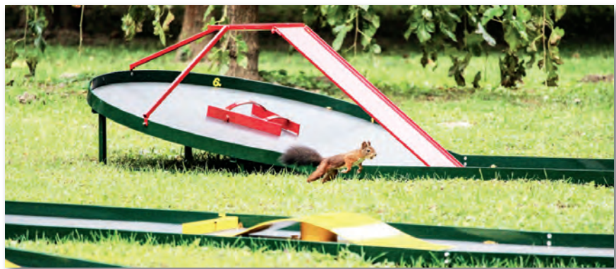
Egy kedves látogató a játszótéren

Télen Mikulásváró délután, adventi hétvége és karácsonyi program várja a családokat.