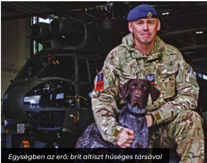
Egységben az erő: brit altiszt hűséges társával