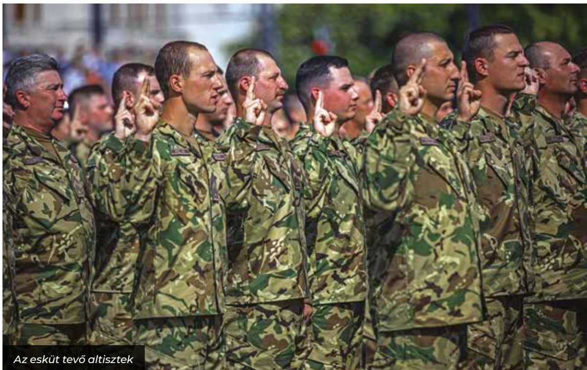
Az esküt tevő altisztek