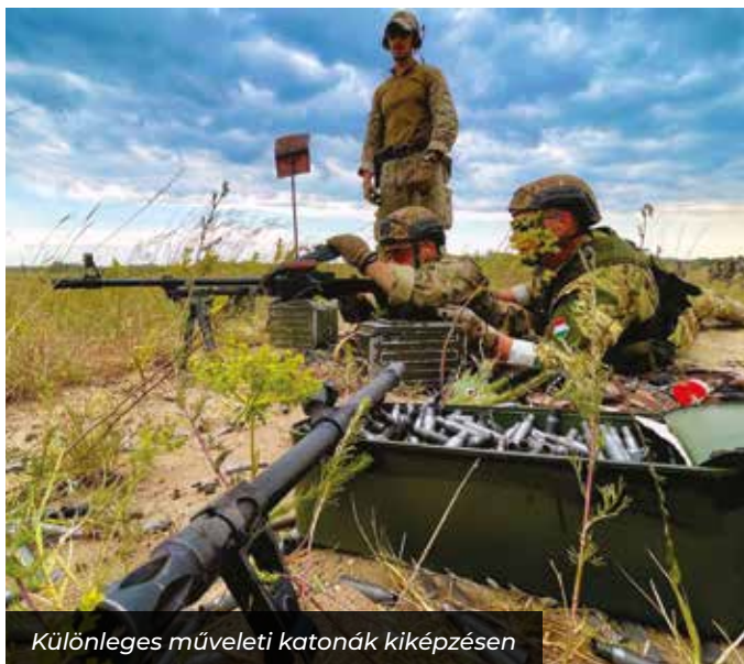
Különleges műveleti katonák kiképzésén