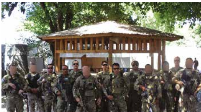
2004-ben volt az első olyan külföldi szerepvállalás, amikor egy komplett, szervezetszerű alegységet vezényeltek missziós feladatra

1996-ban először érkezett amerikai különleges műveleti csoport Magyarországra, hogy kiképzési foglalkozásokat tartson nekünk. Az Egerbakta környéki hegyekben egy hónapos időtartamban folyt a képzés. Azokban a hetekben a Magyar Honvédségben elsőként részesültünk olyan kisalegység-harcászati oktatásban, amely a jelenleg is érvényben lévő harceljárások alapját képezi. Akkoriban a különleges műveleti zászlóaljja válás még nagyon távolinak tűnt. Igazából nem is sejtettük, hogy amit akkor, ott csináltunk, valami jelentős dolognak lesz később az alapja. Hatalmas kontraszt volt az orosz szemlélet és az ott tanult harceljárások között. Nagyon hasznosnak bizonyult a képzés, és akkor ez radikálisan új volt a számunkra, csak úgy ittuk magunkba a látottakat. Természetesen a tapasztalatok feldolgozását követően az akkori hazai harceljárásokat kiegészítettük a korszerű elvekkel, módszerekkel, leszerelve ezzel jó néhány, az újításokat elfogadni nem akaró ember ellen-