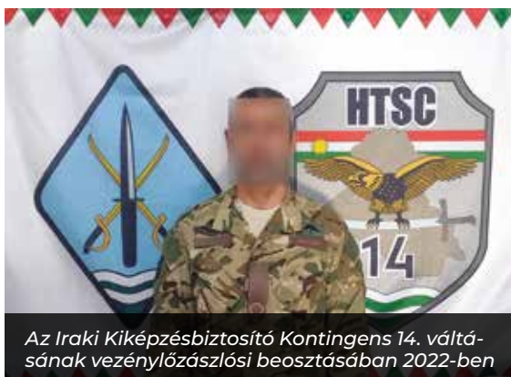
Az Iraki Kiképzésbiztosító Kontingens 14. váltásának vezénylőzászlósi beosztásában 2022-ben

Az altiszti katonai életpálya több tíz év is lehet, ehhez türelem, kitartás és rengeteg munka kell. Meglátásom szerint, aki nem a legkönnyebb és legkevesebb munká-