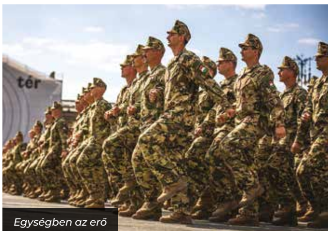
Egységben az erő