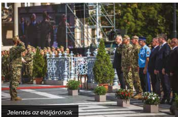
Jelentés az előjárónak