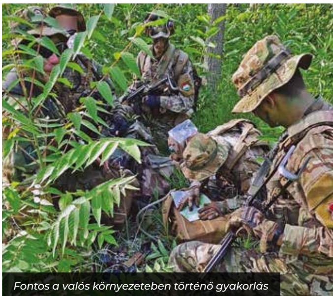
Fontos a valós környezetben történő gyakorlás