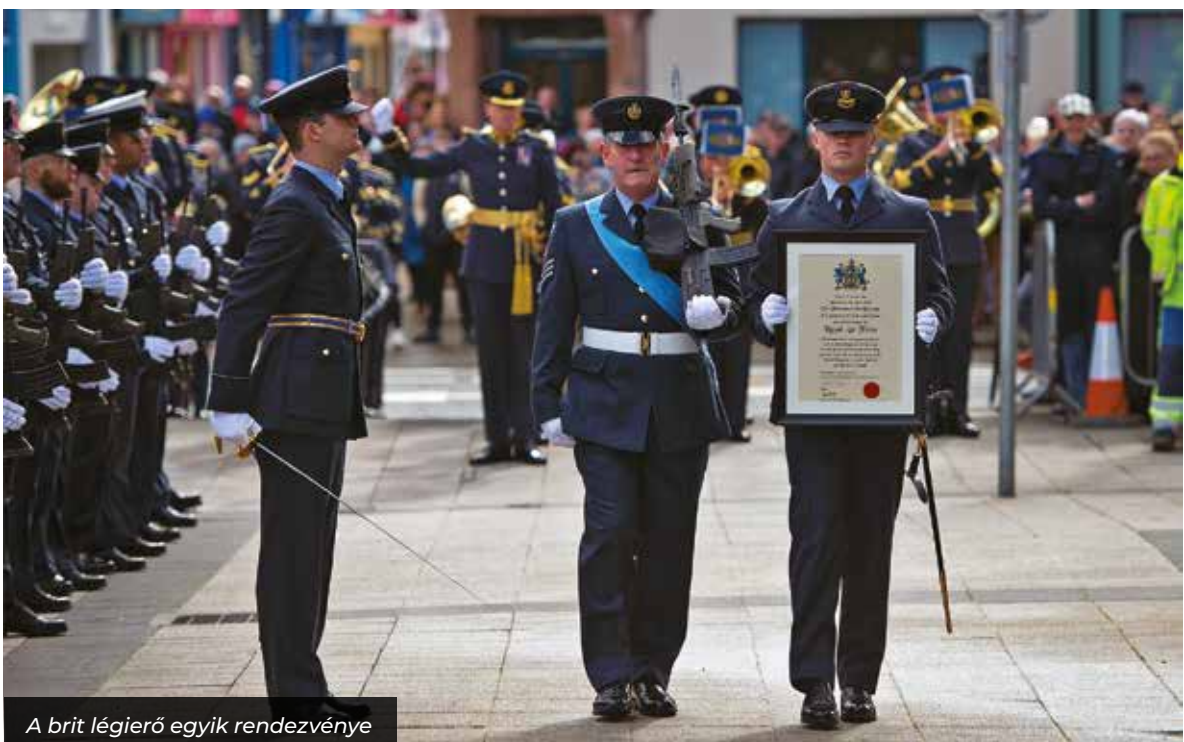
A brit légierő egyik rendezvénye

Amikor a szolgálati feladatairól kérdeztem, elsőként a Csapásmérő Parancsnokságon betöltött menedzsmenttervezéssel, médiával és kommunikációval kapcsolatos beosztását említette. (A 2007-es átalakításig ez a katonai vezetési szervezet irányította a brit haderő vadász és bombázó légi járműveinek döntő többségét.) Fialat tisztként,