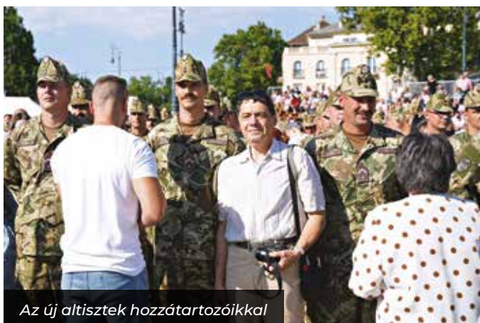
Az új altisztek hozzátartozóikkal