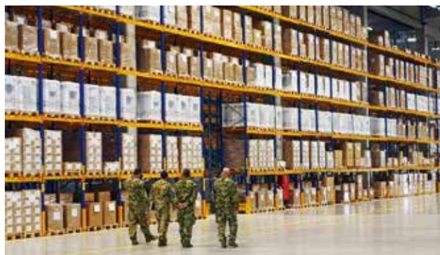
A 20 ezer négyzetméteres tárolófelület három focipálya méterének felel meg