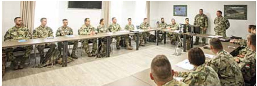
Huszonhárom „acélkocka” vett részt a tanfolyamon

A tanfolyam második napján a hallgatók megismerték a repülőter üzemeltetés és -karbantartás téli időszakra vonatkozó feladatrendszerét, a feladat-végrehajtás technikai eszközeit, főbb harcászati technikai adatait, az eszközök alkalmazásának módszereit. Közlebbi képet kaptak