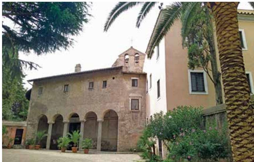
A Szent István vértanú körtemplom

V. Miklós pápa a templomban restaurálási munkálatokat is végeztetett, ekkor épült a nyolcszögletű szentélykorlát, amelyet 24 monokróm freskó díszít. Ezek a vértanú Szent István életét beszélik el. Egy kép azonban látszólag nem illik a sorba: a freskón egy ágyon fekvő nőalakot látunk, aki előtt a papok segítőire, a diakónusokra jellemző ruhát, vagyis dalmatikát viselő férfi áll, aki természetesen Szent István első vértanú. A kép felett látható