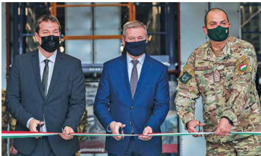
A raktárbázis átadása

Az új raktár – melyet a Veszprémi Ipari Parkban hoztak létre – a Magyar Honvédség Anyagellátó Rak-