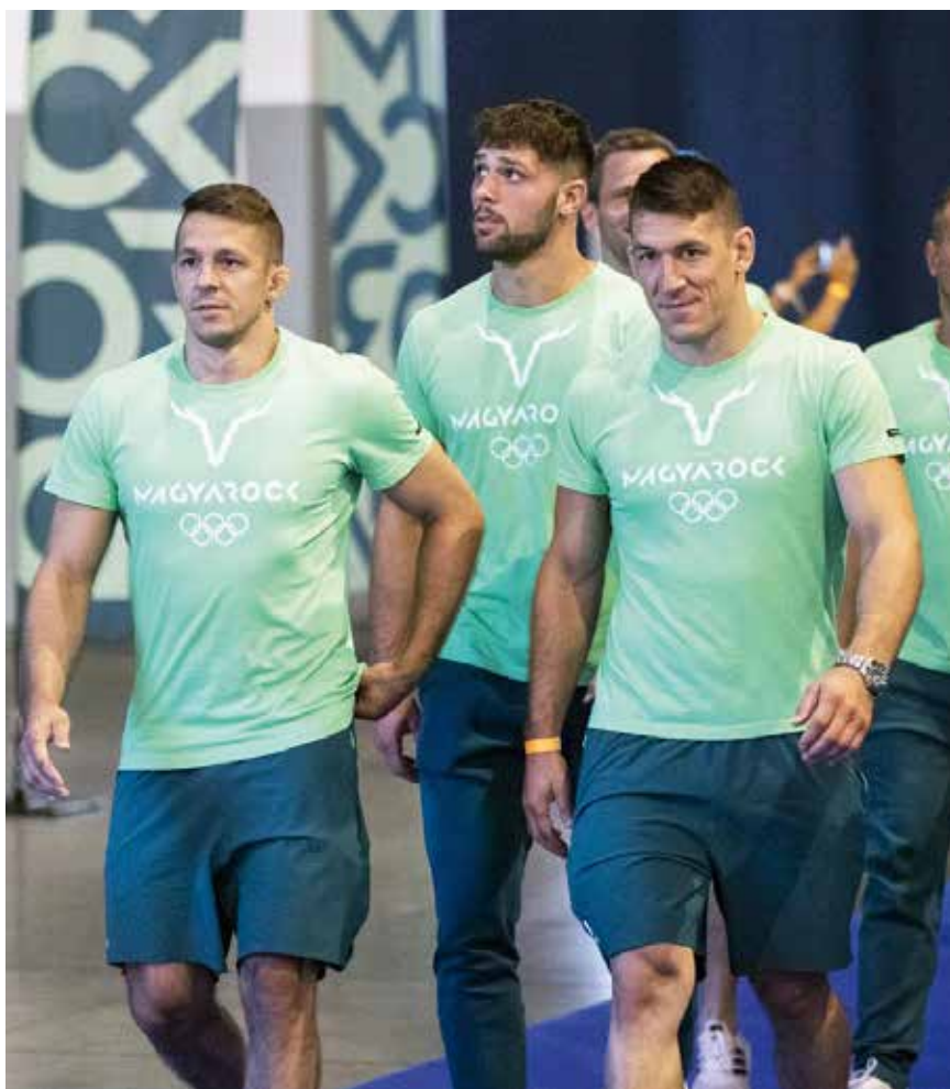
Érkezés az olimpikonokat köszöntő ünnepségre