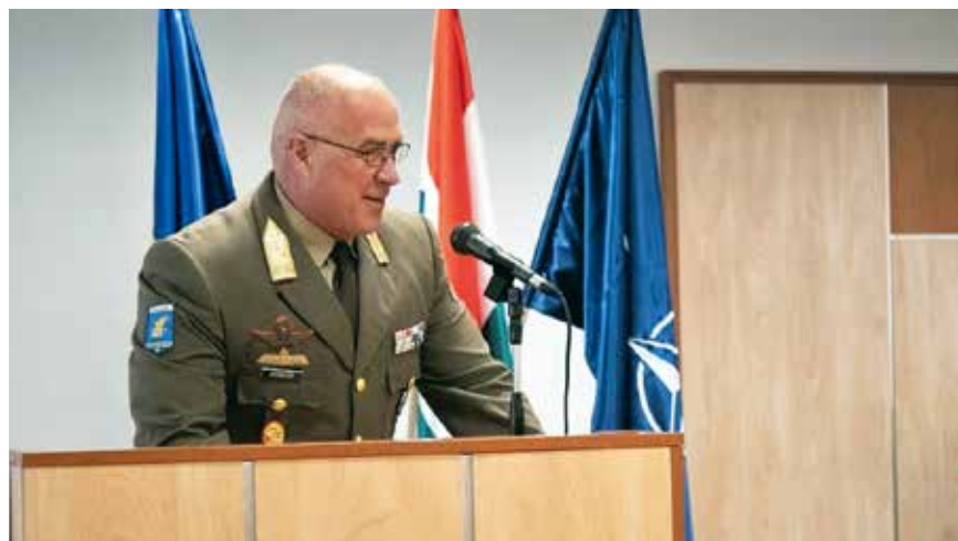
Sándor Zsolt vezérőrnagy köszöntötte a távozót és a hivatalba lépő vezénylőzászlóst

Az ünnepség zárásaként Sándor Zsolt vezérőrnagy, a Magyar Honvédség parancsnokának helyettese köszöntő gondolatai után megtörtént a vezénylőzászlósi vallszalag, valamint emléklapok átadása.