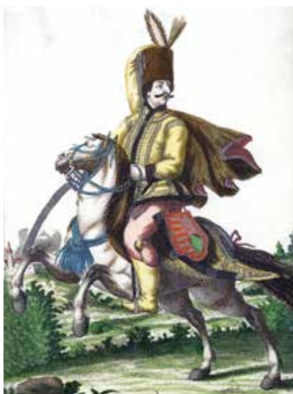
Huszár a 18. században

A 16. század közepére a nehézlovasság szinte teljesen kiszorult a csataterекről, helyét az ellenséges oszmán haderő sajátosságai miatt hazánkban a könnyűlovasság