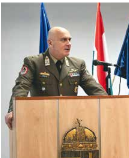
Kriston főtörzszászlós tíz év után adta át utódjának az MH-vezénylőzászlósi beosztást

Kriston főtörzszászlós új beosztásáról így nyilatkozott a honvedelem.hu-nak adott interjúban: „Az én elsődleges feladatomban a továbbiakban a miniszter vezetői tevékenységének hatékony támogatása az altiszti és legénységi állományt érintő kérdésekben. Nagyon fontos látni, hogy az altisztek helye és szerepe nemcsak Magyarországon, de az egész világon felértékelődik a hadviselés, a technikai eszközök változásával. Ebből következik, hogy nélkülözhetetlen az altisztek felkészítése, integrálása, és ezen folyamatok támogatásának legjobb eszköze egy tapasztalt altiszt. Ahogy mondani szoktuk: a tisztek mondják meg, hogy mit akarnak és mikorra, az altiszteket pedig hagyják végrehajtani, végrehajtani az általuk megszabott feladatokat. Az irányítás szintjéről nézve képviselem a miniszteri, illetve tárcaszintű honvédelmi irányelveket is. Az alárendelt katonákat a Ma-