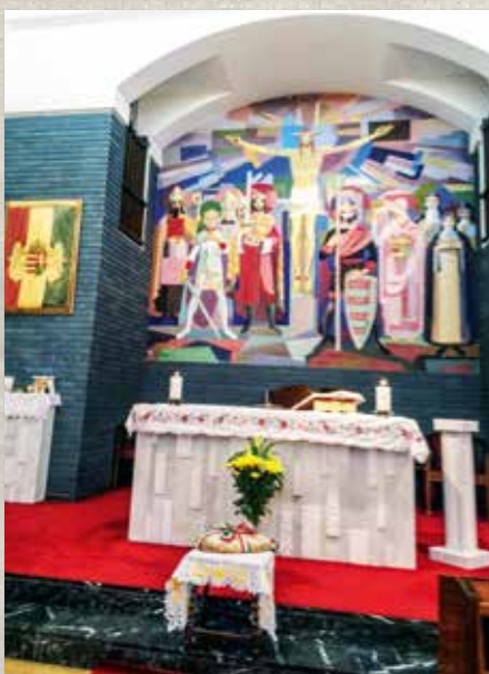
Külföldön. Szent István a magyar szentek társaságában (Szent István Ház kápolnája, Róma, Via del Casaleto 481.)