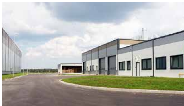
Az épületek impozáns látványt nyújtanak

Egy teljesen új, komplex és sokrétű tárolás valósul meg itt, köszönhetően az itt tárolt anyagok – ruházati, élmezési, híradóanyagok, térképek, humán, fegyverzettechnikai, vegyvédelmi felszerelések – sokféleségének. A felsorolásból adódik, hogy teljesen új szemléletre van szükség ahhoz, hogy a raktárbázist sikeresen lehessen működtetni. Területe 20 ezer m 2 magastárolású raktár; összehasonlításképpen ez kb. három focipálya méretének felel meg.