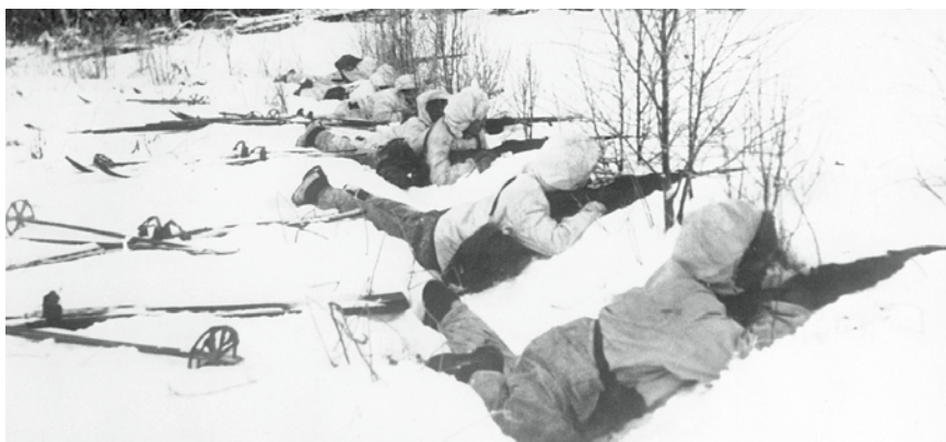
Finn sítalpas őrző, 1940

a. Két módszer létezett a peremvonalban védő csapatok megsemmisítésének megelőzésére.