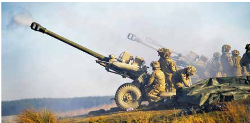
Amerikai M-198 tarack és kezelői Falludzsa mellett, 2004

e. Az előrevonási útvonalak állapota alapvető fontosságú volt, ezért minden körülmények között járhatóan kellett tartani azokat. Az útszűkületeket el kellett kerülni, a rombolt utakat meg kellett javítani, még zord időjárási körülmények között is, és szigorú forgalomirányítást szabtak meg kétirányú forgalom részére.