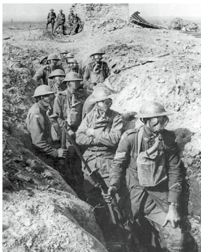
Ausztrál katonák az yperni szektorban, 1917

Nagyobb harci képességein kívül a védekező félnek nem volt más eszköze hátrányai ellensúlyozására, mint rugalmasabb és kifinomultabb harceljárások alkalmazása. A legfelsőbb vezetés felelőssége volt annak felismerése, hogy a támadók létszámfölellyét csak a védők