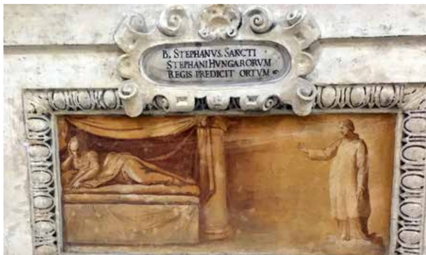
Az első vértanú, Szent István megjövendőli Szent István magyar király születését

nevet vette fel a keresztségben, vélhetően azért, mert a bajorországi Passau Egyházmegye székesegyháza, ahonnan Magyarországra missziós papok jöttek és püspök is érkezett, Szent István első vértanú tiszteletére van szentelve. A két István találkozása a Santo Stefano Rotondóban a név királyi jelentésén túl a keresztény hit szilárd talaján vállalt szolgálatban is összekapcsolódik. Államalapító királyunk, bár nem volt vértanú, de országát örök alapértékekre építette, amelyek erkölcsi zsinórmértékül szolgálhatnak minden országlakónak hitre és felekezeti hovatartozásra való tekintet nélkül. Az emberi élet méltóságát