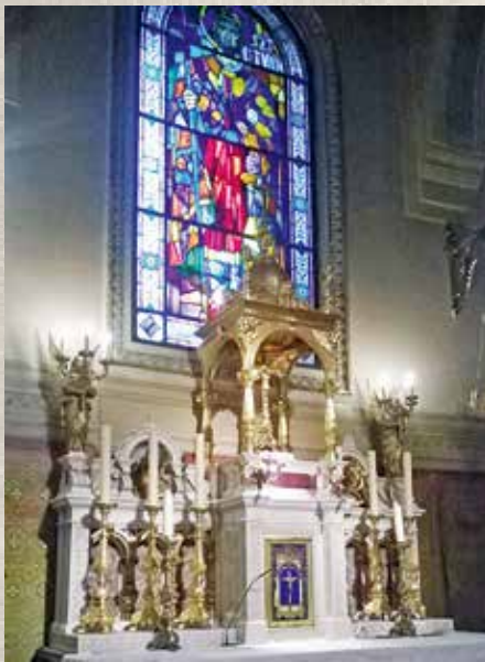
A lélek gondozása. A Szent István-bazilikában lévő Szent Jobbkápolna (Budapest, V. kerület)