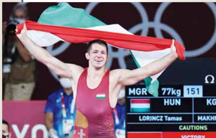
Akik történelmet írtak (28. oldal)