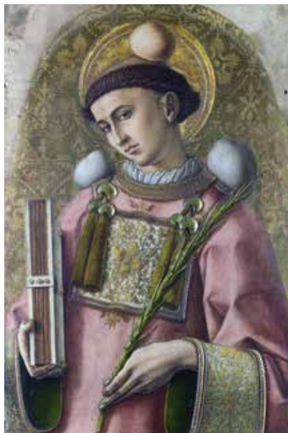
Szent István vértanú (1 körül–36/40 körül)

A római lateráni bazilika teréről azonban most gondolatban tovább sétálunk a Kolosszeum irányába a Róma hét dombjának egyikén, a Céliuszon álló Szent István vértanú körtemplomhoz, a Santo Stefano Rotondóhoz, amely ezer szállal kötődik hazánk történelméhez. Képzeltbeli sétánkat a Santo Stefano Rotondo utcán tesszük meg, amelyet a szóban forgó templomról neveztek