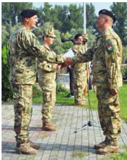
Elismerés a kiváló szolgálatért

A modern kor újfajta kihívások elé állítja katonáinkat. A napi feladatok ellátása mellett kiveszik részüket a migrációs válság kezeléséből Magyarország határfolyóin és egyéb hajózható vizein. Kiemelkedő helytállással vettek részt az elmúlt időszakban árvizek, hajózási balesetek elhárításában, azok következményeinek felszámolásában, a folyókban és tavakban előtálatl háborús robbanóeszközök kiemelésében, és jelenleg is aktívan vesznek részt a COVID-19 vírus elleni küzdelemben. A kórházakban nyújtott támogatást vagy a közterületi járőrszolgálatot említhetjük itt, a teljesség igénye nélkül. A Zrínyi Honvédelmi és Haderőfejlesztési Program keretében a közelmúltban két tűzszerész járőrhajónak sikerült megújulnia. A kiképzések végrehaj-