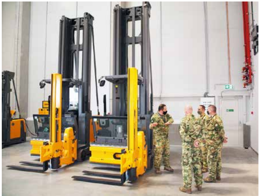
Korszerű targoncák segítik a munkát

A Központi Raktár területén kialakított egyéb kiszolgálóhelyiségek: gépjárműjavító műhely; karbantartó műhely; lakatosműhely; konzerválóműhely; szociális helyiségek; fegyverszoba; zárt gépjárműmosó (-10 és +50 Celsius fok között); üzemanyag-töltő állomás (10 m 3 ).